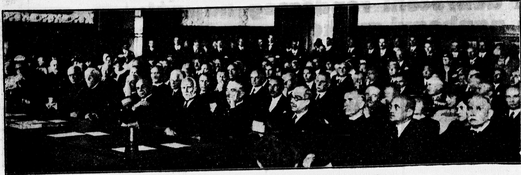
A tiszai ág. ev. egyházkerület közgyűlésének közönsége.