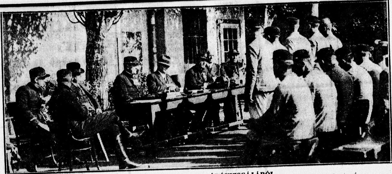
A TÚZOLTÓTANFOLYAM ZÁRÓVIZSGÁJÁRÓL.

— Zita királyné spanyol földre érkezett és vasárnap átment a nemzetközi hidon, mely francia területéről spanyol területre vezet. A spanyol nemzetiek külföldisége várta a hídfőnel.