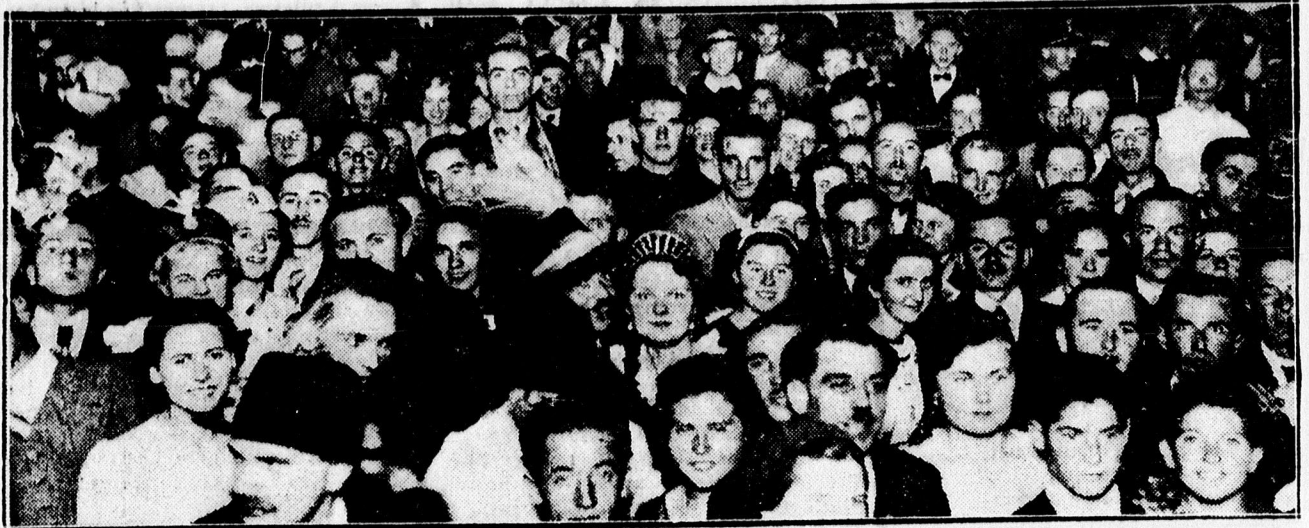
Egyetemi altisztek szüreti mulatsága a Koronában.

— Borzalmas cirkuszdráma. Koppenhágából jelentik: Roskilde dán városában borzalmas cirkuszi dráma játszódott le. Egy medveidomító cigányt leánya, fia és menyé szemellettára meg támadott egy megvadult medve s a szoros értelmében szétdarabolta az idomítóját. A cirkuszi személyzet azonnal az idomító segítségére sietett, hogy megmentse a megvadult állat mancsai közül. Tíz percig tartott ez a szörnyű küzdelem, amíg végül aztán rendőrök érkeztek, akik agyonlőtték a medvét és ezzel a szörnyűségnek véget vetettek. Amikor az idomítót a kretrebből kiemelték, már olyan borzalmas súlyos sérüléseket és akkora vérvesztést szenvedett, hogy kórházszállítás közben belehalt sérüléseibe.