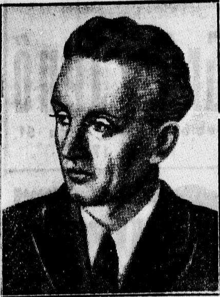
SZENT-GYÖRGYI ALBERT szegedi egyetemi tanár megkapta a Nobel-díjat.

A „KISPIPA“ !! minden szombaton !! !! reggelig nyitva !!