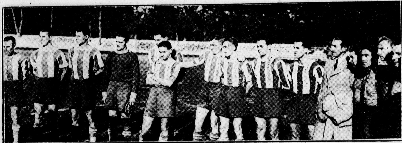
A Ferencváros csapata.