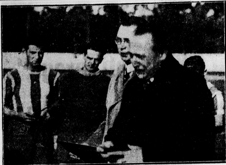
Kölcsy polgármester üdvözi a Ferencváros játékosait.