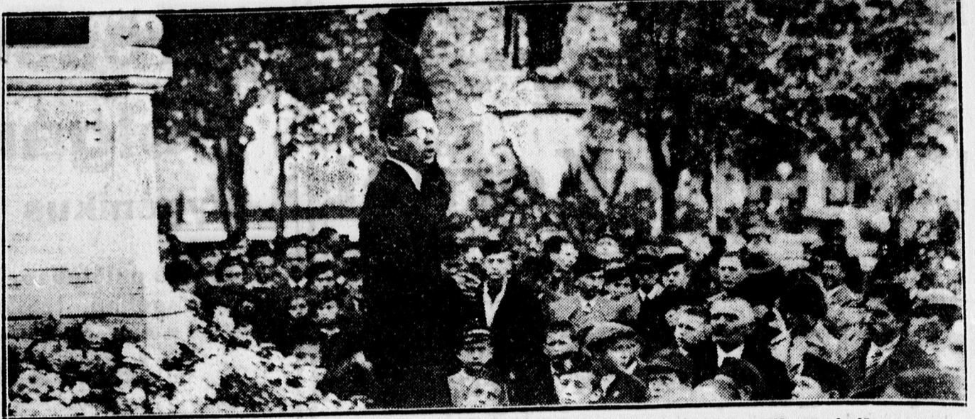
A th eológiai ifjuság reformációt emlékünnepe a Gályarabok emlékművénél.