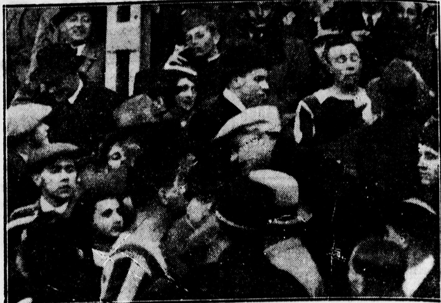
Izgalmas jelenet: Toldi és Tátrai vitája a nézőkkel.