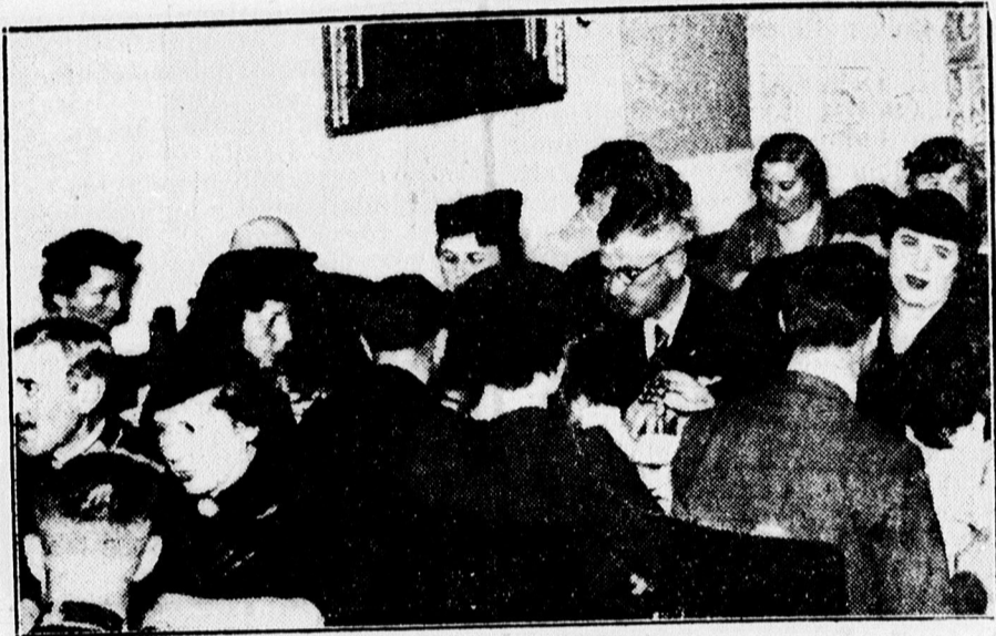
Kép a Kálvin-teatról.