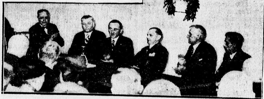
A Szárnyaskereké Egyesület Horthy-kép leplezési ünnepségéről.

Majd rátért az ünnepély céljára, a kép leplezésére és mikor szavai közben lehullott a lepel, a közönség fellállással percekig ünnepelte a kormányzót.