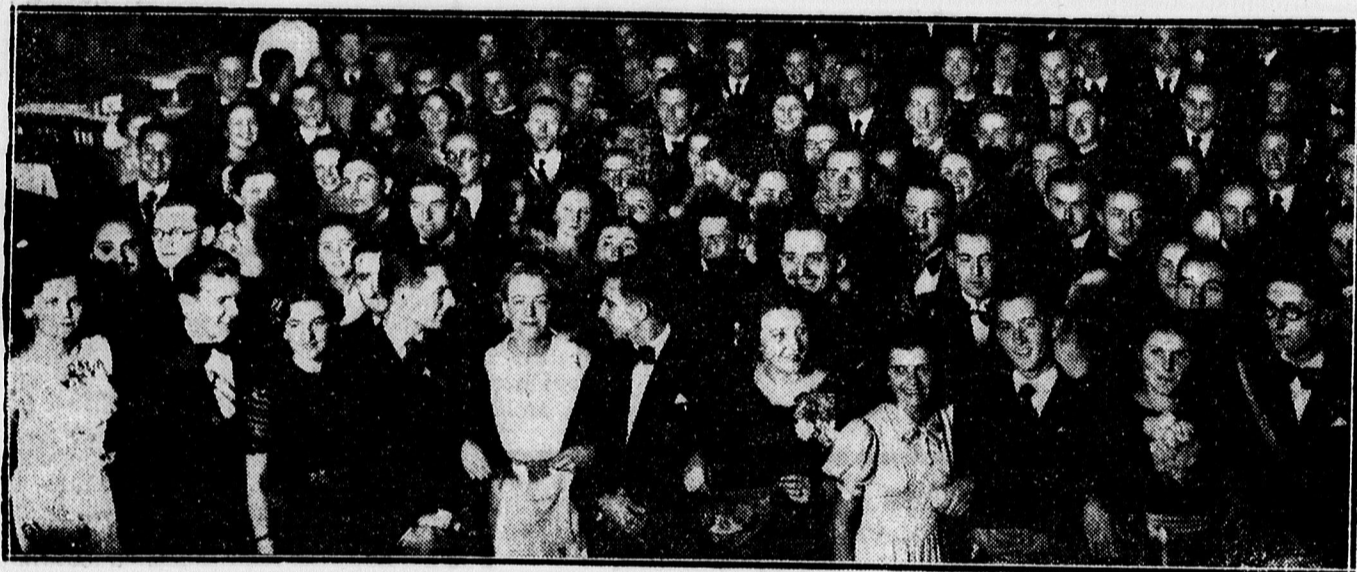
Horthy -törzs disztáborozásáról az Arany Bika dísztermében. A táncoló fiatalság.