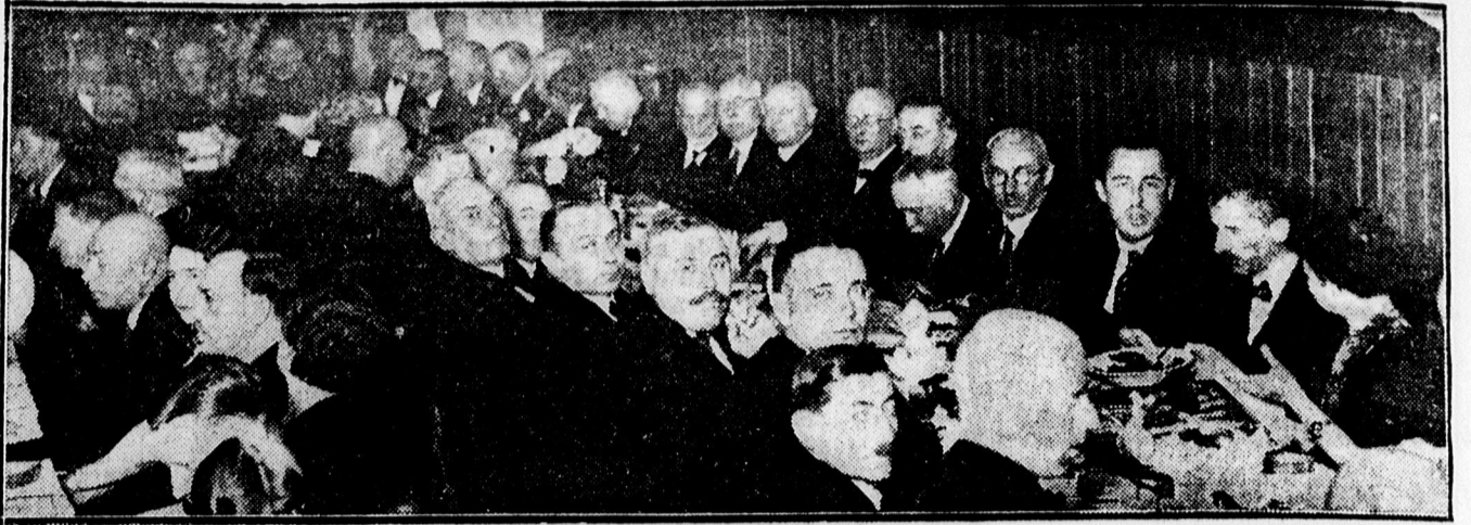
Igazságügyi tisztviselők vacsorájának közönsége a Vitézi Székházban.

— A jugoszláv miniszterelnök Rómában, Rómában nagy ünnepélyességgel fogadták a jugoszláv miniszterelnököt, Sztójadinovicsot. A fogadásra Mussolini és külügyminisztere Ciano is megjelent. A jugoszláv miniszterelnök, mint az olasz kormány vendége tartózkodik Rómában.