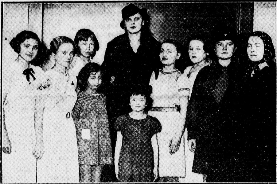
Szvingárdisták Mikulás-estjének szereplői a piarista gimnázium dísztermében.

— Szerelmi dráma történt Bécsben. Mydlik János kertész egy borotvával elvágta Ehar Leopoldina nyakát, azután a saját nyakán ejtett mély sebet a borotvával. A leány meghalt, a merénylő haldoklik. A kertész szerelmi féltékenységeben követte el tettet.