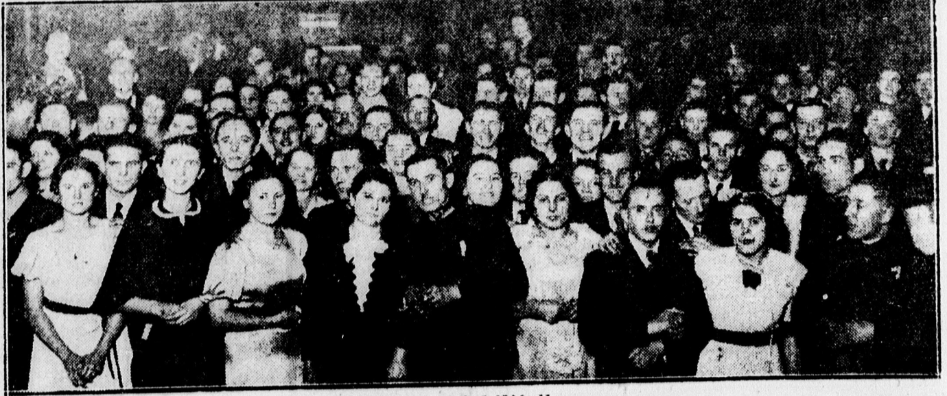
A postaaltisztek báljáról.