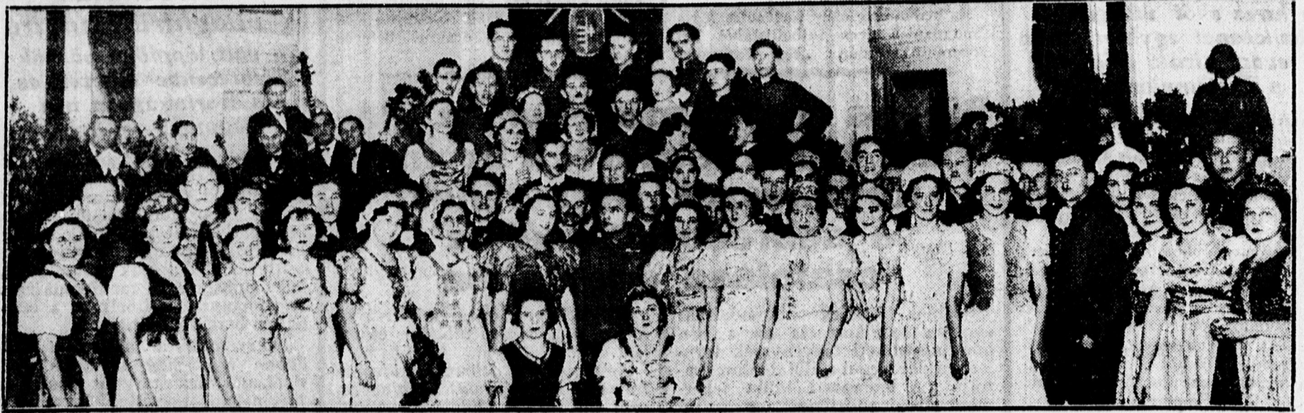
Magyarruhás csoport az ref. urasszonyok által rendezett „Magyar Esten” az Arany Bika disztermében.