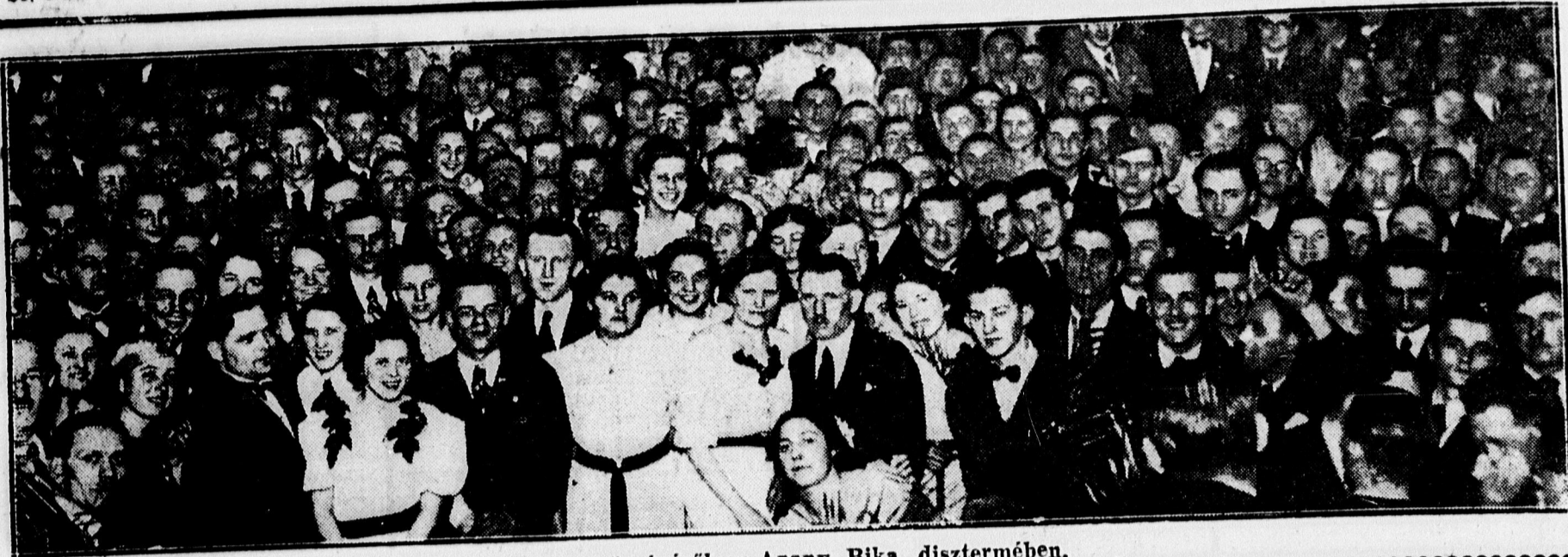
Iparos-bál közönségéről az Arany Bika disztérmeben.