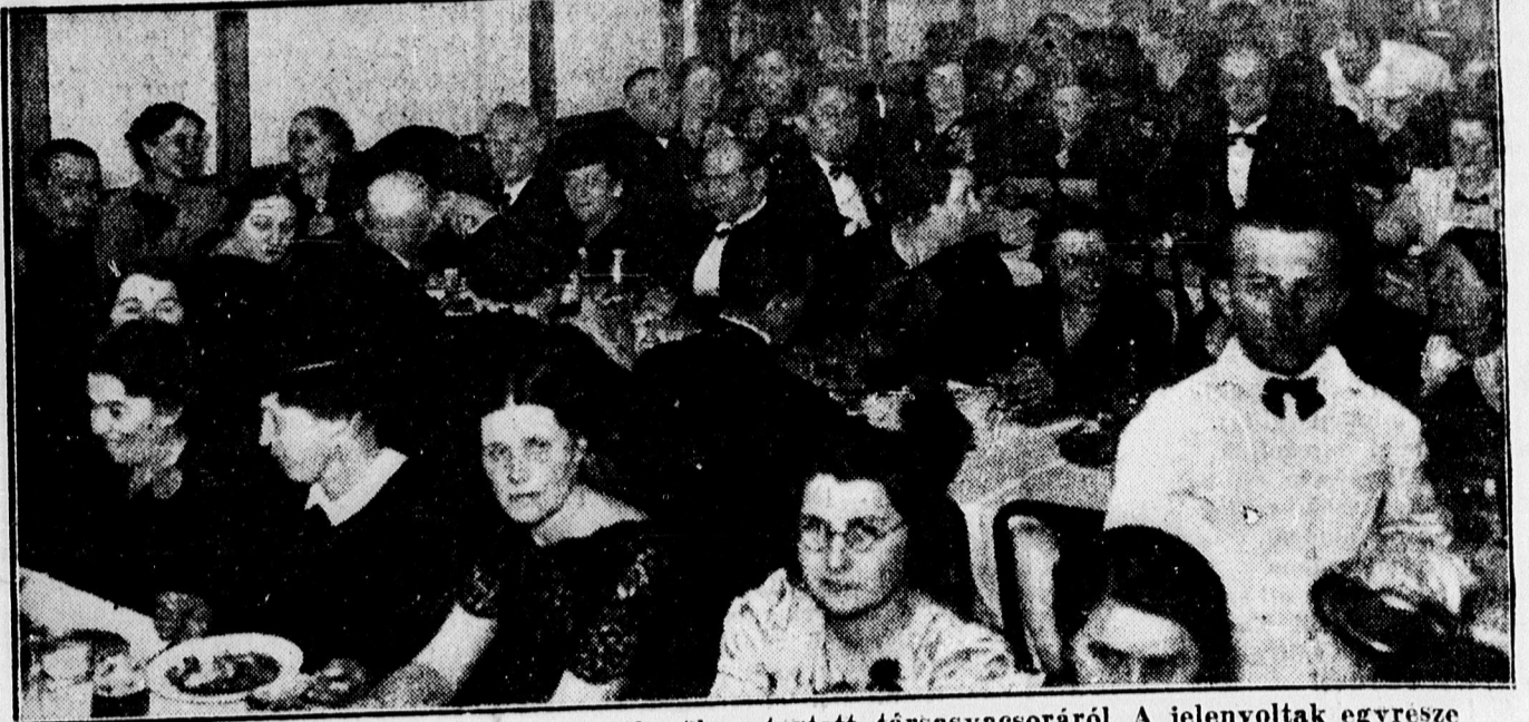
A Piarista Diákszövetség által az Angol Királynőben tartott társasvacsoráról. A jelen voltak egyesre