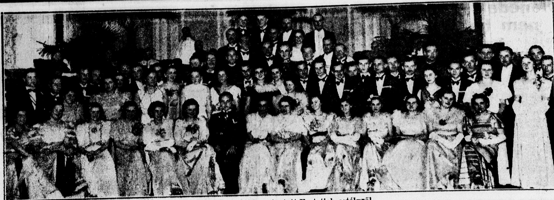
Az Arany Bika disztermében tartott Festetich estélyről.