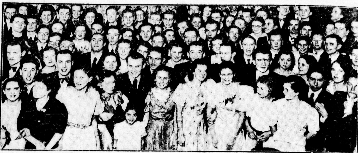
A Lilla-est táncoló fiataljainak egyrésze az Arany Bika dísztermében.