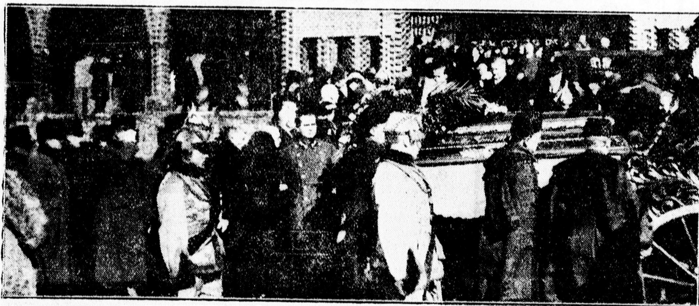
Galánffy János temetéséről.

A búcsúbeszéd után mentőorvosok vették vállukra a koporsót és úgy vitték a gyászkoosíhoz. A kecsi oldalán díszkíséret lépkedett és a tüzoltók fátyolai lobogtak az alkonyatban. A tüzoltók kürtöse búsan fújta kürtjét és a sírnál, míg a koporsót leengedték, a tüzoltók szíriái búgtak. A temetést a Gebauer temetkezési intézet rendezte kegyeletlen körültekintéssel.