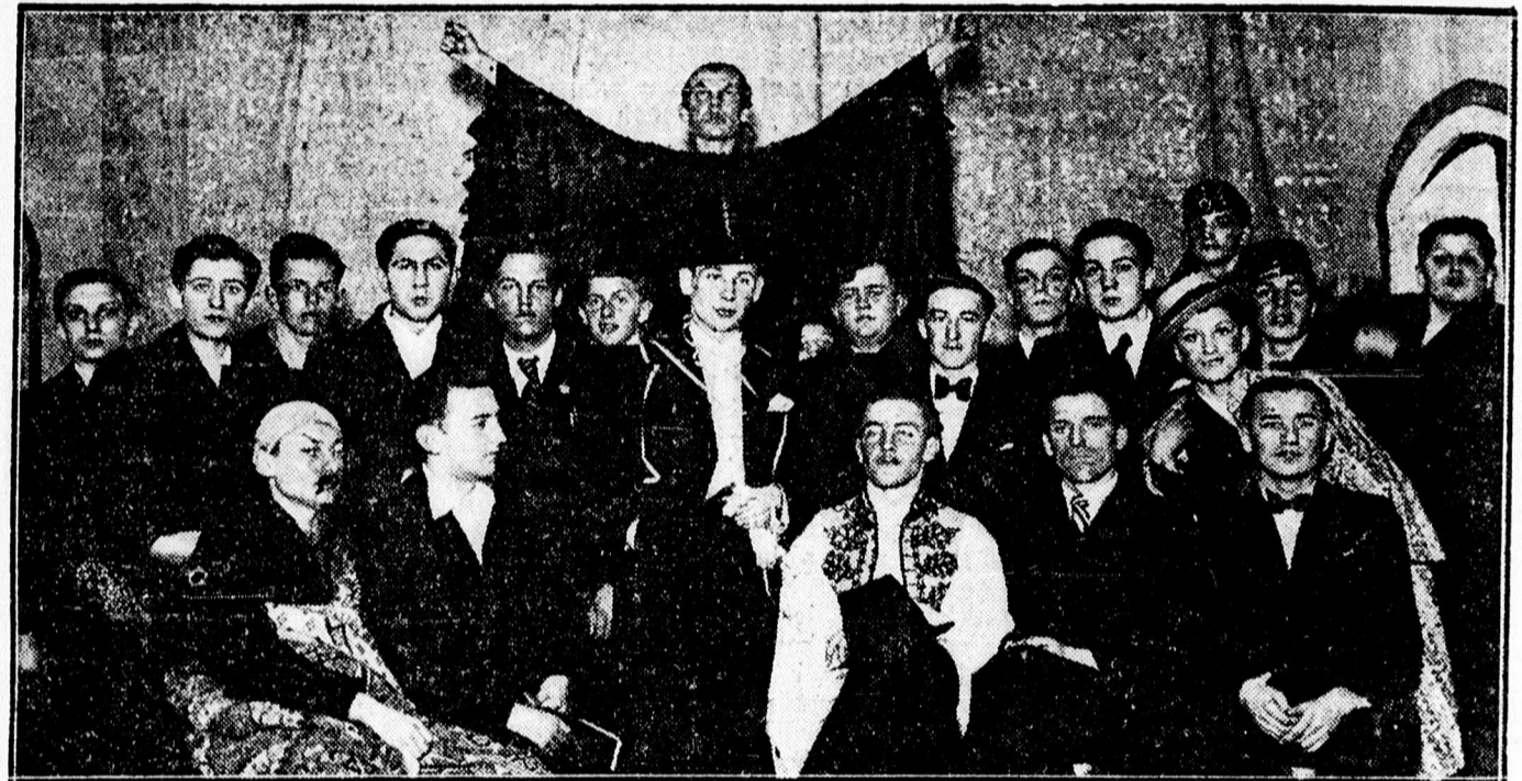
A kat. gimnázium növendékei által rendezett farsangi előadás szereplői.