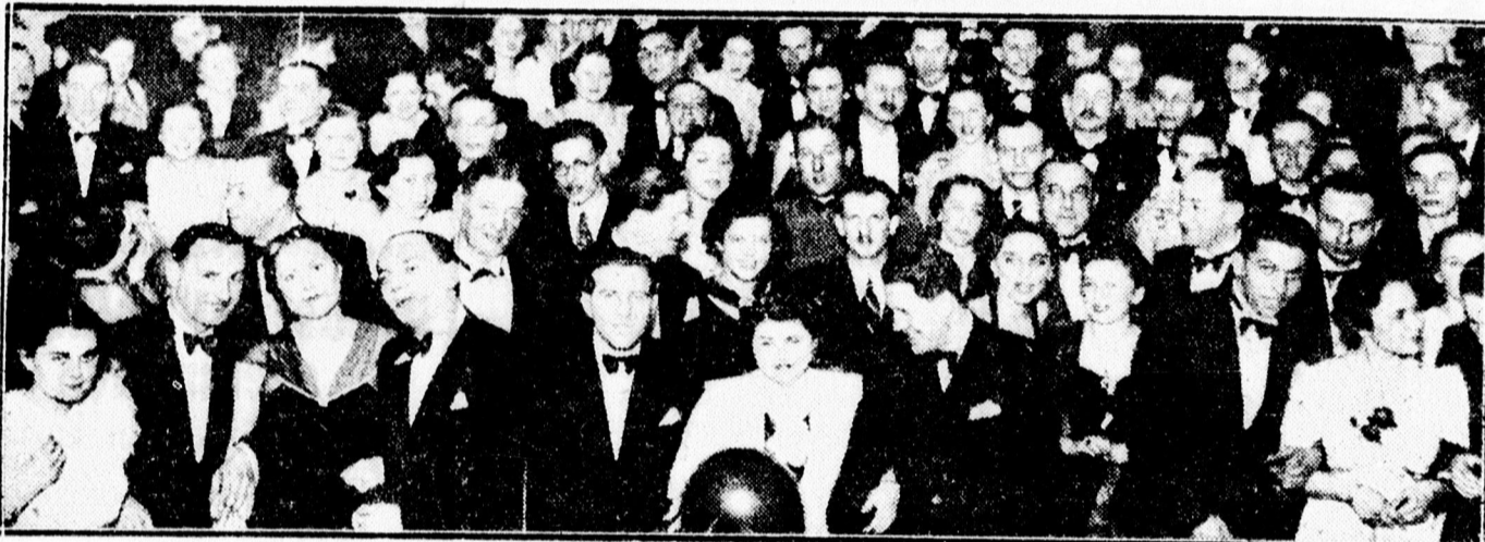
Miefhoe-bál közönségéről az Arany Bika dísztermében.