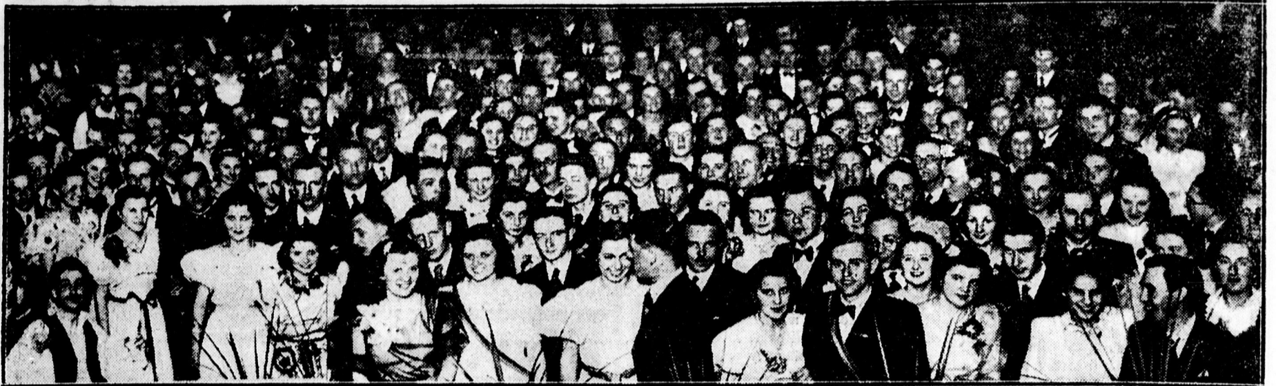
Táncoló fiatalság a Szeffe bálon a Bika dísztermében.