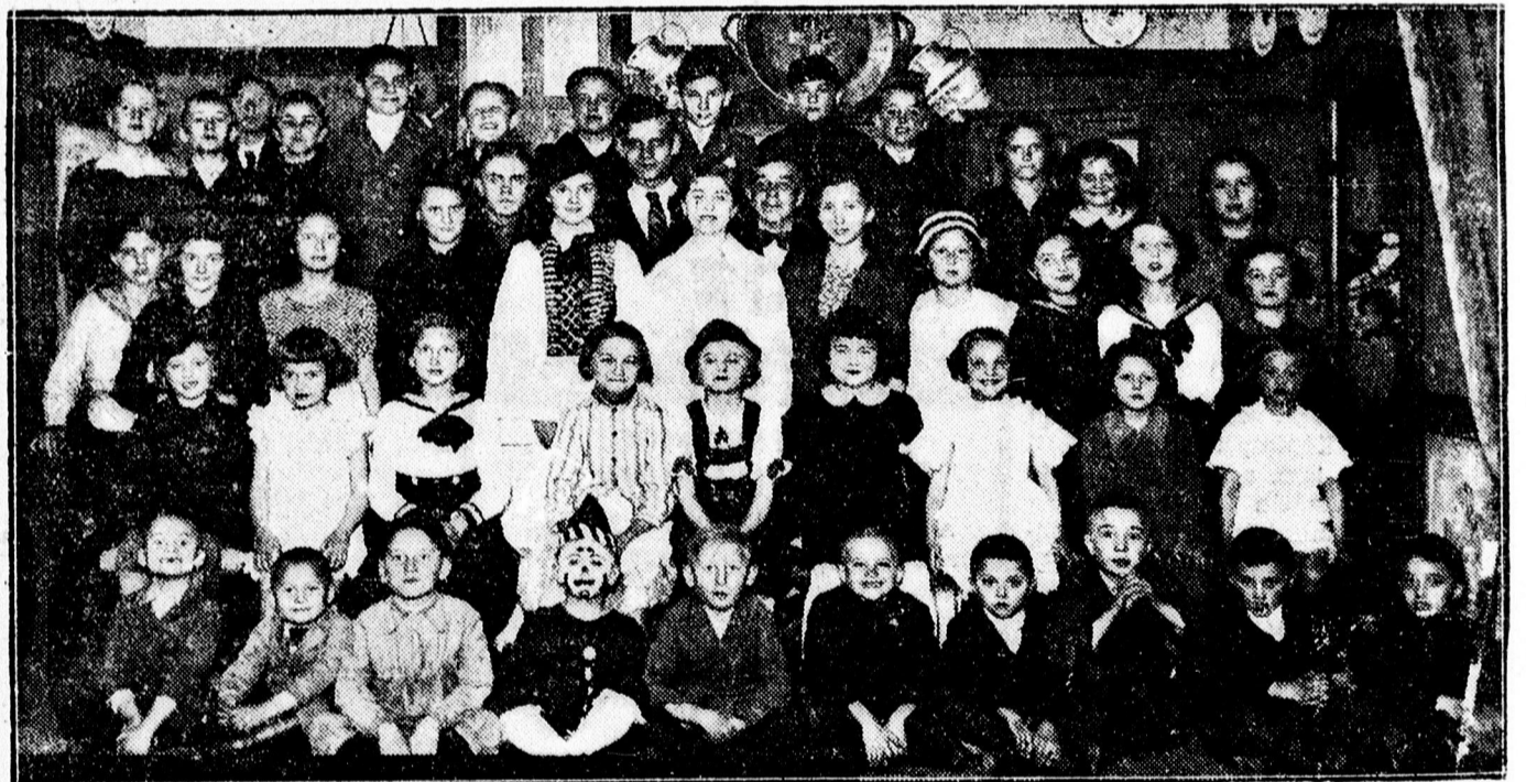
A „Hal Samu” gyermekbábkomédia tansági előadásának szereplői.