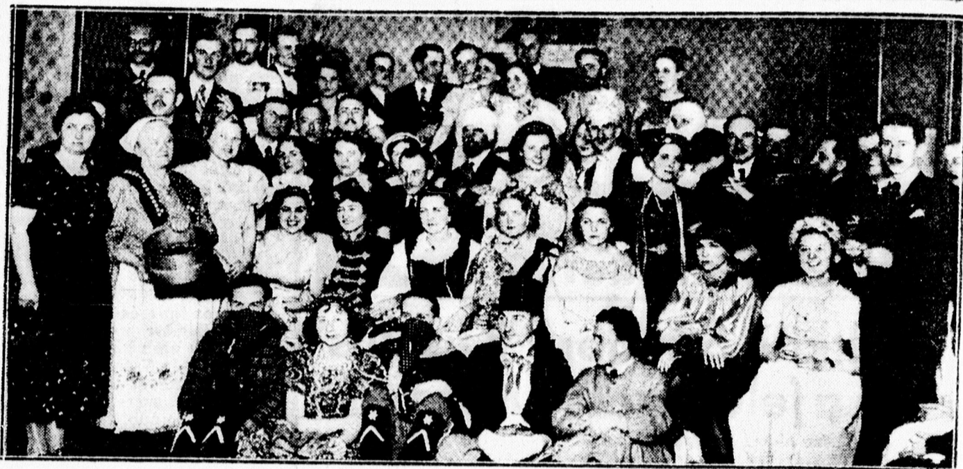
A Turista-estély közönsége az Angol Királynőben.