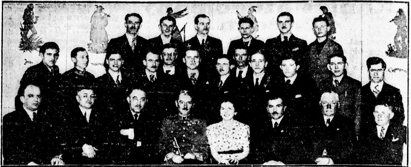
Postagalambtenyésztők gyűléséről az Angol Királynőben.

x Szódavizét még mindig olesón készítheti otthon Autosiphonnal. Képviselet Szent Anna u. 5.