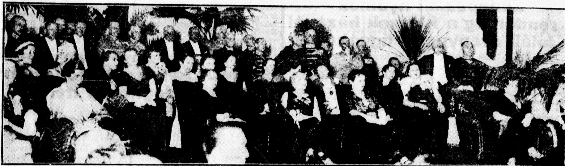
A nagyszerű helyorségi bátról az Arany Bika disztermében. — Előkelőségek a diszemelvényen.