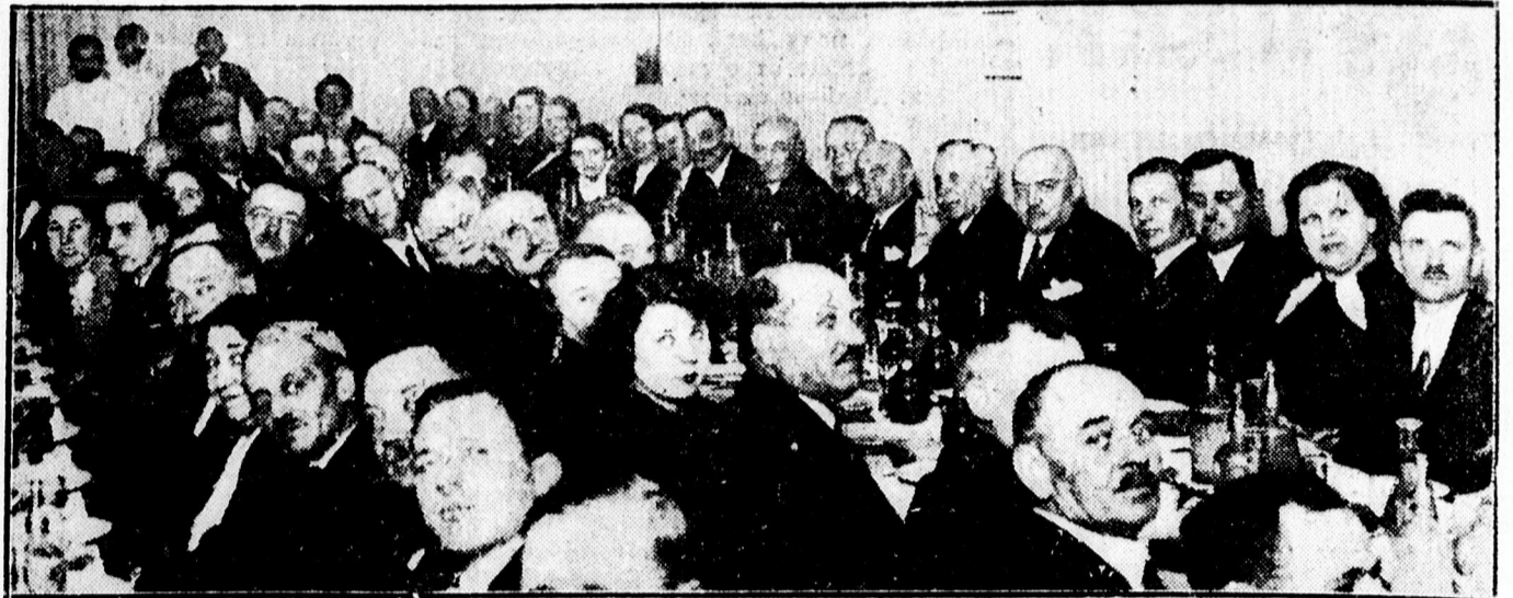
Az 55 nyugalomba vonult MAV s. tiszt fiztetelére rendezett társasvacsora résztvevői a „Szárnyas-kerék”-ben.