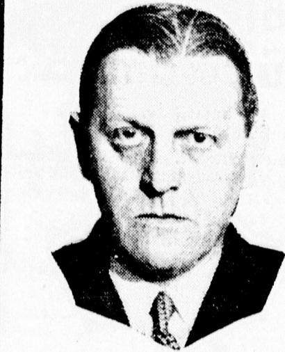
FEY EMIL őrnagy, volt osztrák kancellár, ki családjával együtt öngyilkos lett.

Berlin, március 17. A birodalmi gyűlés pénteki ülésének egyetlen tárgya épp úgy, mint a birodalmi