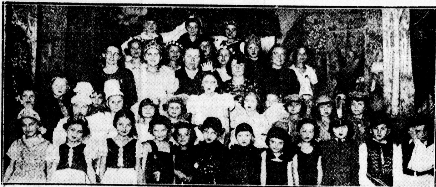
Homokkerti Kisleánykör nagy sikerrel adta elő a „Hófehérke” című darabot. — A szereplők.