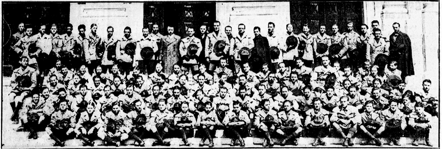
A budapesti 13. számú Ezeremester cserkészcsapat az egyetem előtt.