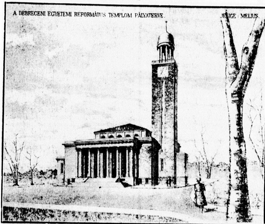
Az első díjat nyert pályaterv.

Az egyetemi templom meghirdetett tervpályázatának eldöntése tegnap délelőtt megtörtént. A pályázatot kiíró bizottság meglehetősen nehéz feladat elé állította a tervezőket, mert megkívánta, hogy klasszikus stílusban tervezzék meg a templomot, ami bizonyos kötöttséget jelent, mert nem esaponghat szabadon a tervező képzelete. Valószínűleg ennek az eredménye, hogy a tervezők kénytelenek voltak alkalmazkodni és különösen a Kollégium stílusa kínálkozott arra, hogy annak nyomdokait kövessék. Különben a kiíró bizottság ki is kötötte, hogy vagy a központi egyetem, vagy a Kollégium stílusát kell szem előtt tartaniok.