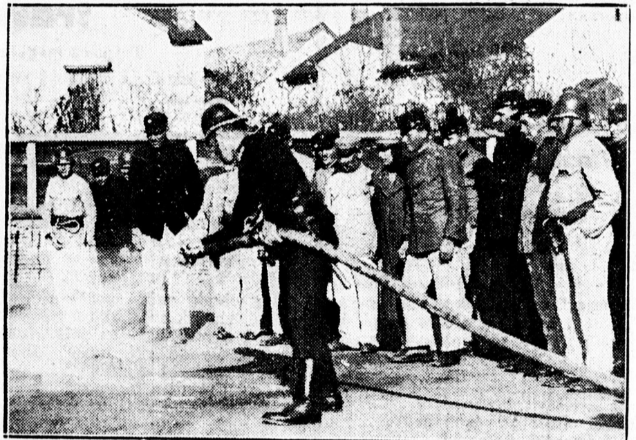
A tűzoltótanfolyam hallgatói az oltást figyelik.