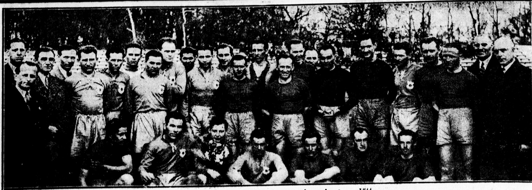
A Törökvs és a Villanygyár csapata a vasárnapi meccs előtt.