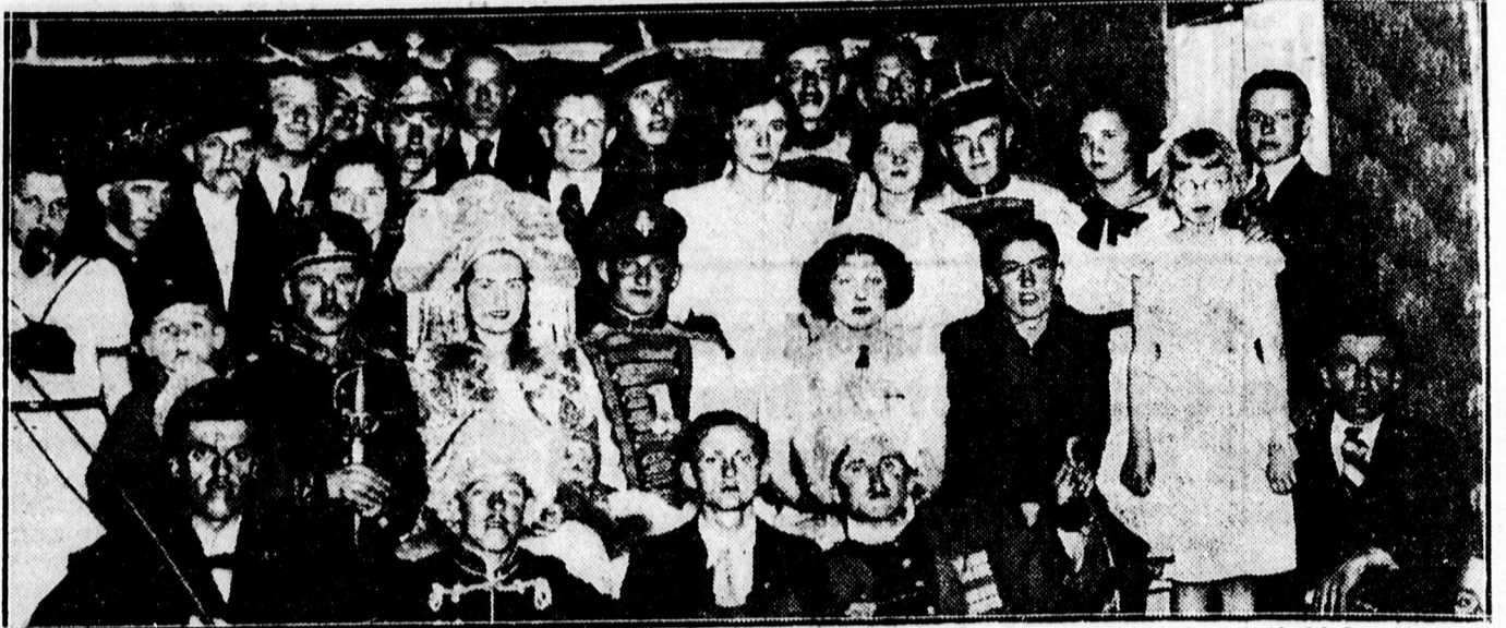
A teglaskerti műkedvelők nagy sikerrel adták elő a „Sibill” című nagy operettet a Teglaskerti F. C. javára. Képünkön a szereplők.

— Széplő, májfolt ellen „Rózsa” orv. kenőcs tégelyenként 1.20 Jóna és Jóna utóda, Somogyi drogériában, Kosuth ucca 6.