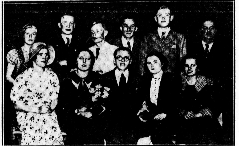
A Böszörményi uti Olvasókör műkedvelői szép sikerrel adták elő a „Vadvirág” című színművet, Képünkön: a szereplők.

— Meghalt bárciházi Bárczy István miniszterelnökségi államtitkár édesanyja, a Kassa melletti Kőcsön. — Az idős úriasszony 80 éves volt.