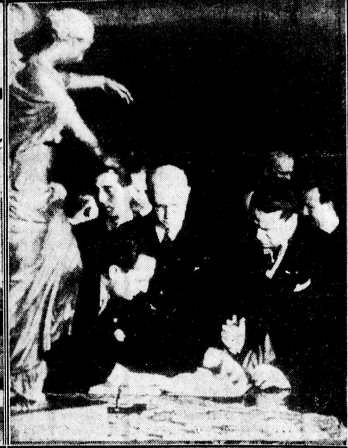
Az angol-olasz egyezmény ünnepélyes aláírása a római külügyminisztériumban.