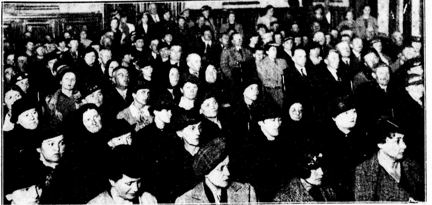
A baromfitenyésztők egyesülete által rendezett tenyésztési tanfolyam hallgatósága.

x Tükrök, előszoba, fürdőszoba, s varrószaalonokba, üvegciszolás, üvegzés, Sípkovitsnál Nagyvárud uca 15. (telefon: 22-96 szám).