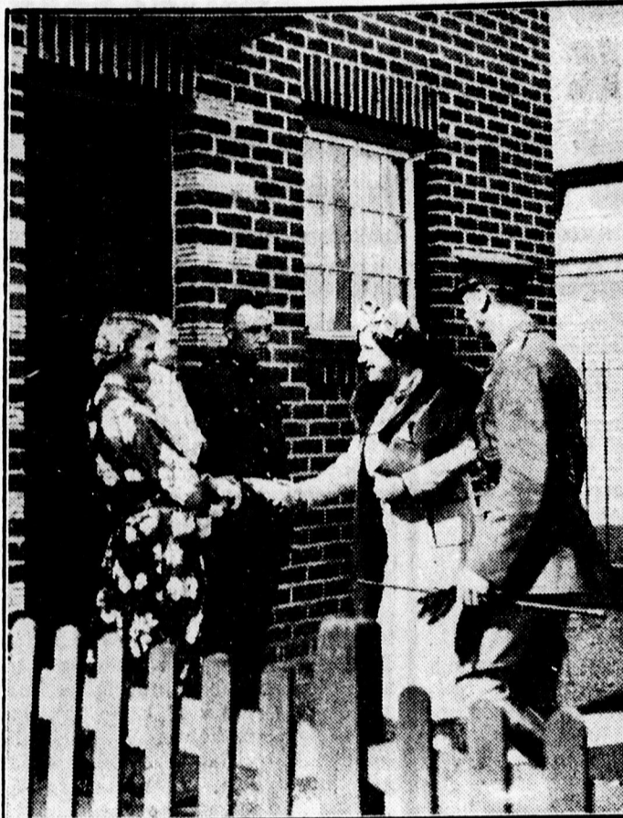
Az angol királyi pár meglátogatja egy katona otthonát és üdvözli a családot.