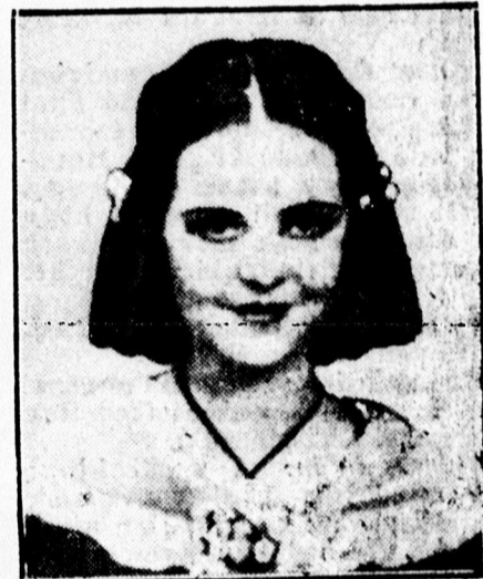
Apponyi Geraldine királyné.

rályi pár Durazzóban a királyi nyári palotájában fog lakni. Az ünnepségek az egész országban a királyi párnak hódoló lakosság teljes részvétele mellett folytak le. Az esküvői ünnepségek idejében a mohamedánok, katolikusok és a keresztény ortodox egyház tagjai „Isten békéjét” kötötték.