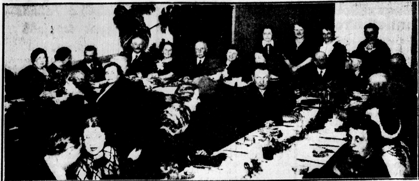
A Vasutas Mansz vacsorája a Szárnyaskerek dísztermében.