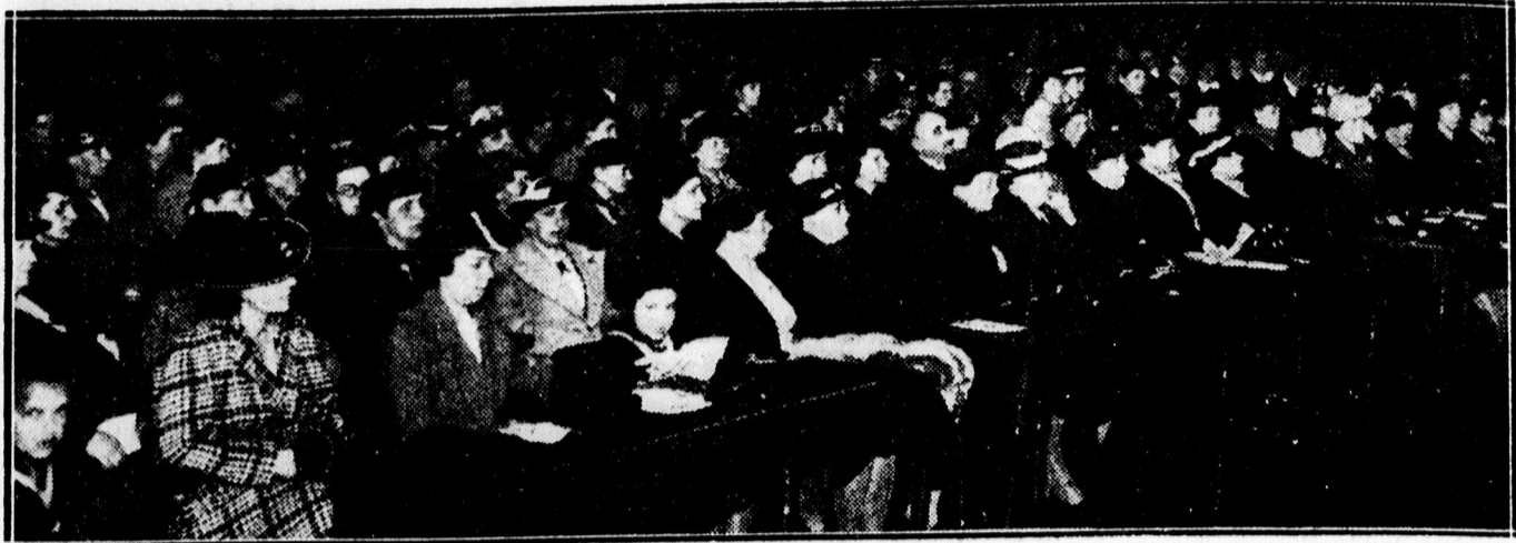
Anyánapi estély a Vármegyeház dísztermében.

— Goga végrendelete a eszesai kastélyt a kolozsvári körögkeleti püspökségre hagyományozta azzal a kikötéssel, hogy a parkban akar eltemetkezni. A temetés esütörtökön lesz államköltségen, nagy pompával.