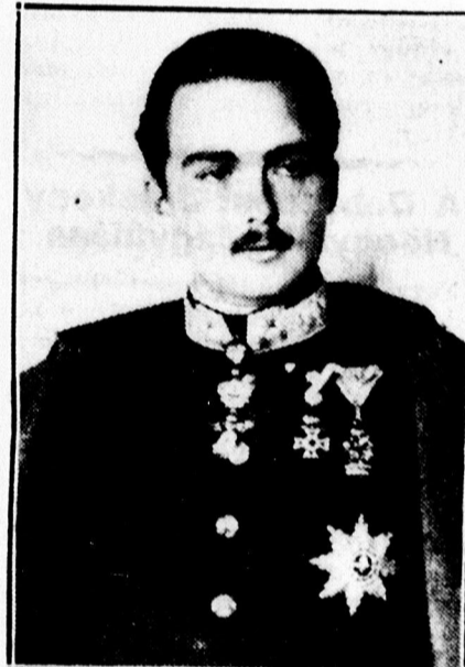
Ottó királyfi legújabb fényképe.

Halmi közelében a csempészek és esendörök között tűzharc keletkezett, de a nagy zavarban sikerült a visszatűzelő csempészeknek elmenekülni.