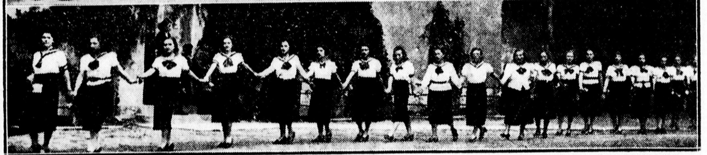
Ballagás és a VIII. osztálybeliek bucsúzása a Dóczy intézetben.