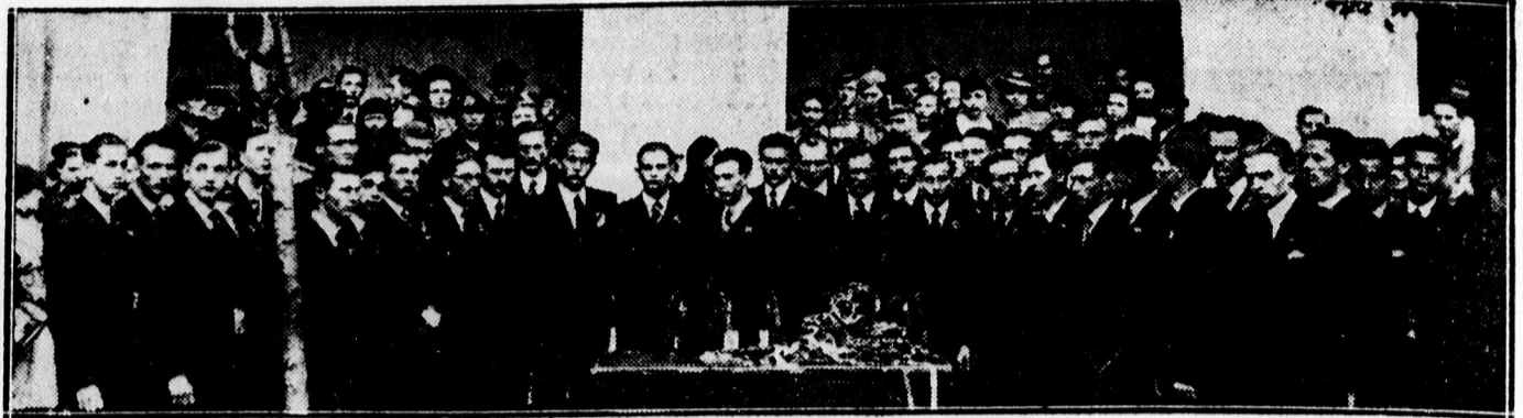
Ref. tanítóképzősök ballagására gyűlekeznek.

— A 70 éves fiu megölte 100 éves apját Londonban. Haranis, a 70 éves öszszakállu gyilkos a bíróság előtt tette okául azt hozta fel, hogy 100 éves édesapja minden pénzét nőre költötte.