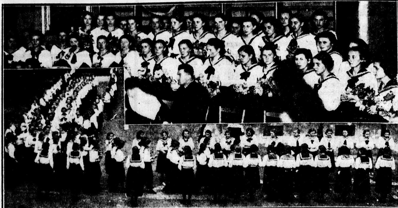
Fent: A Svetits intézet V. oszt. hallgatóit bucsuztatják a tornateremben. — Lent: Tanítónőképzsők ballagása a Svetits intézet udvarán.

A jegyek ára ötven fillértől 2 pengőig van megállapítva, diákjegy harmadik fillér.