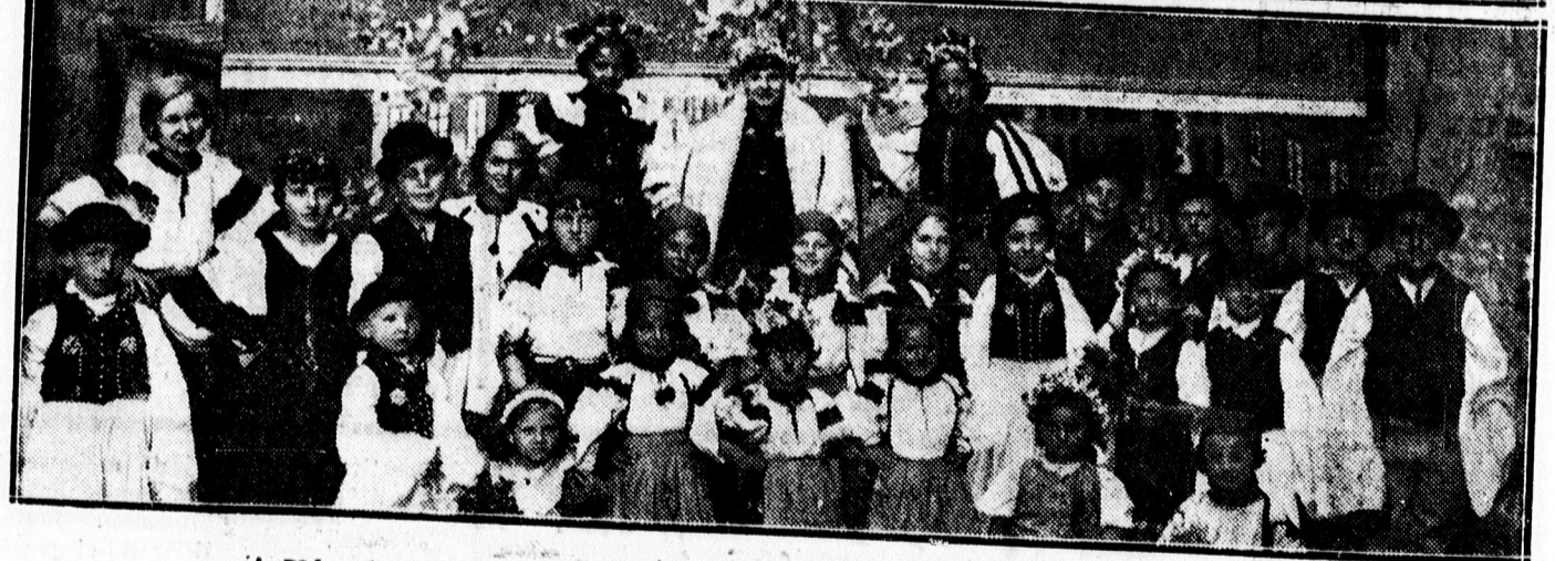
A Városi Zenede gyermekkórusa által rendezett előadásának szereplői.