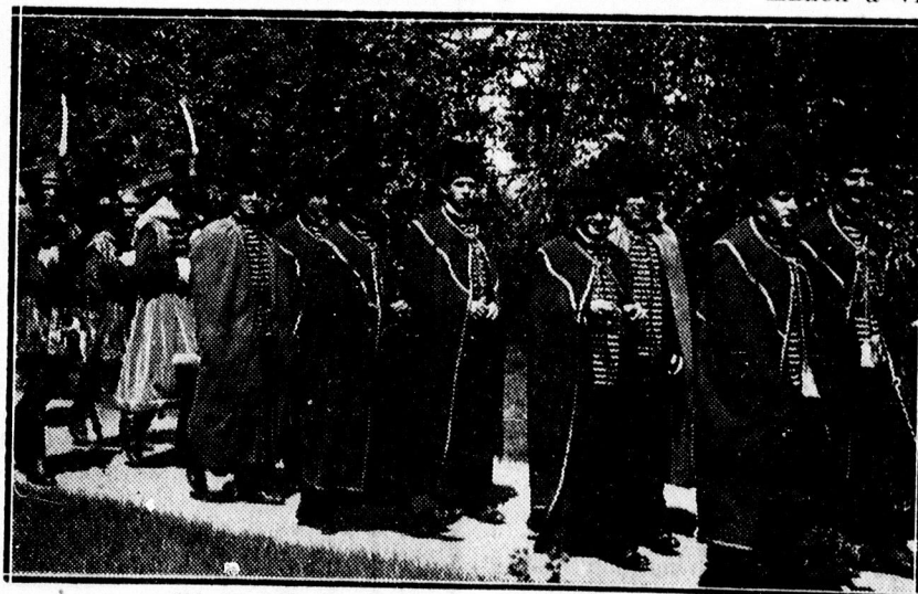
Tógás diákok az egyetemi évzáróra indulnak.