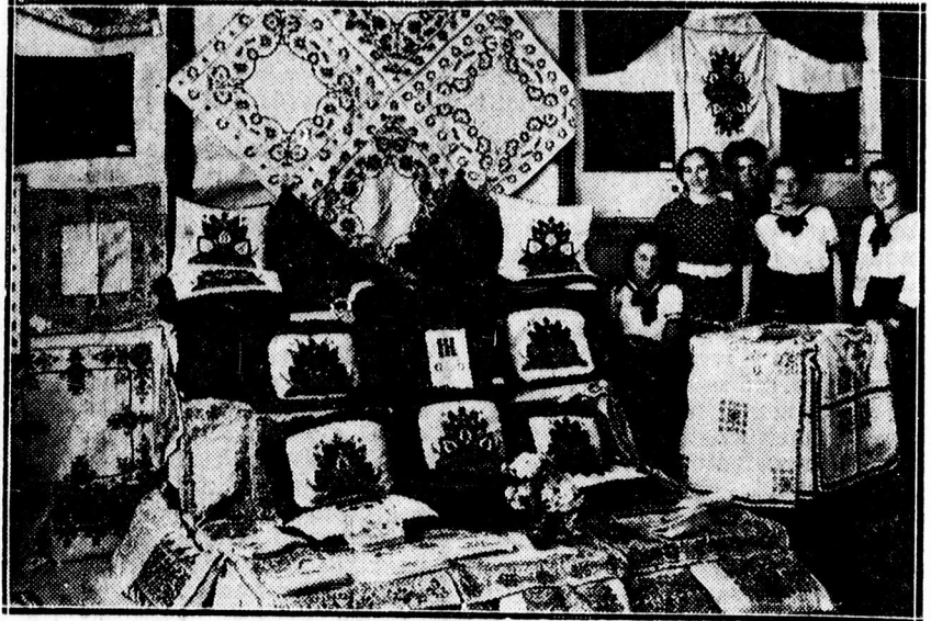
Dócei polgári iskola kézimunkakiállításáról.