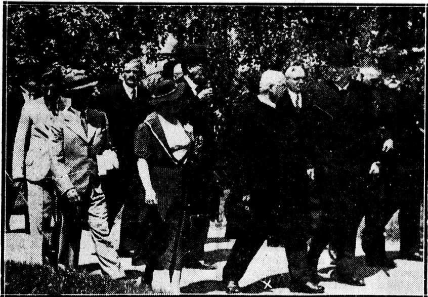
Csikesz rektor kíséretével az évzáró istentiszteletre megy.

— Erről a felelősségteljes helyről bele kell kiáltanunk a négy égtáj felé, hogy az árva Magyarország legárvább része ez! Ennek a vi-