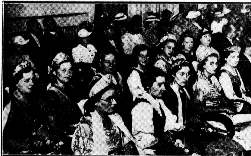
Koszorusleányok csoportja a díszközgyűlésen.