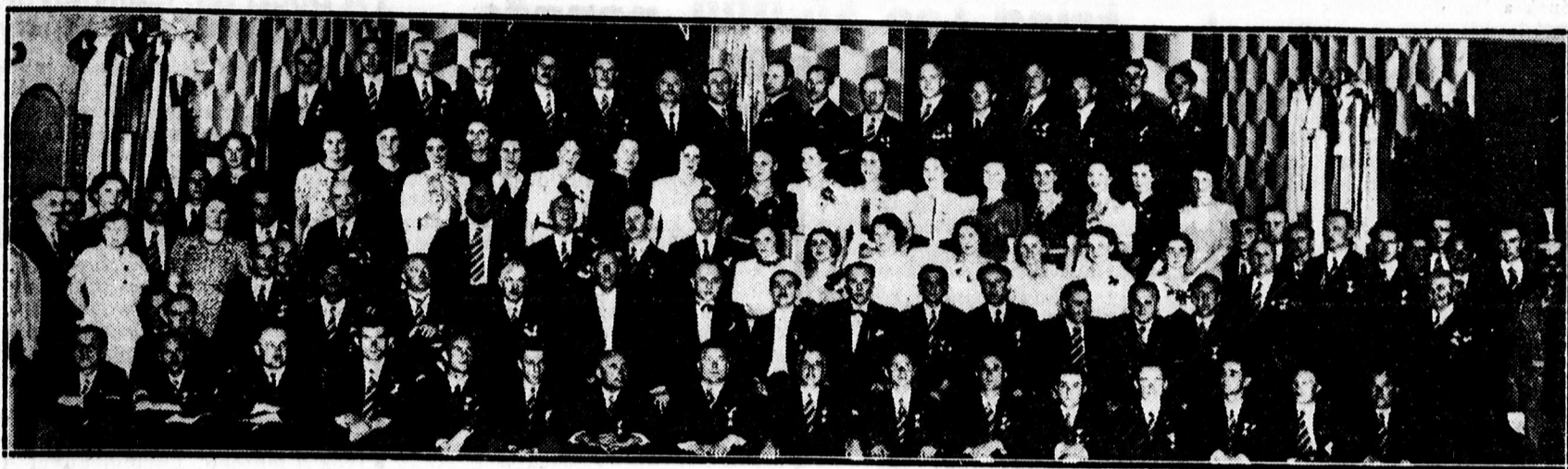
A jubiláló Városi Dalegyelet vezetősége és működő tagjai.