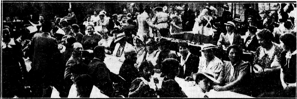
A Szeretetszövetség Fagylaltdélutánjáról. (A közönség egyrésze.)