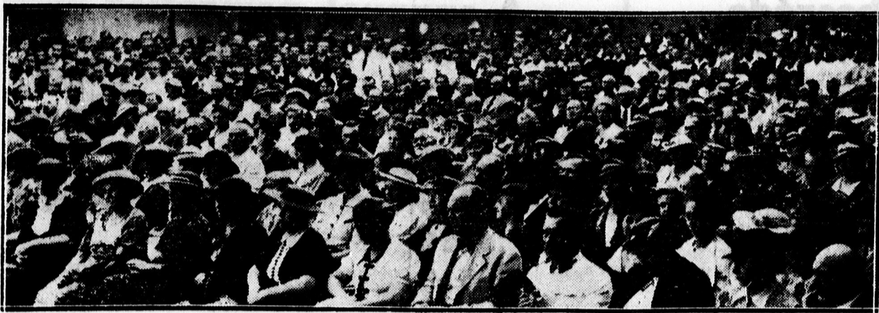
Piarista gimnázium évváró ünnepélyéről. A közönség.