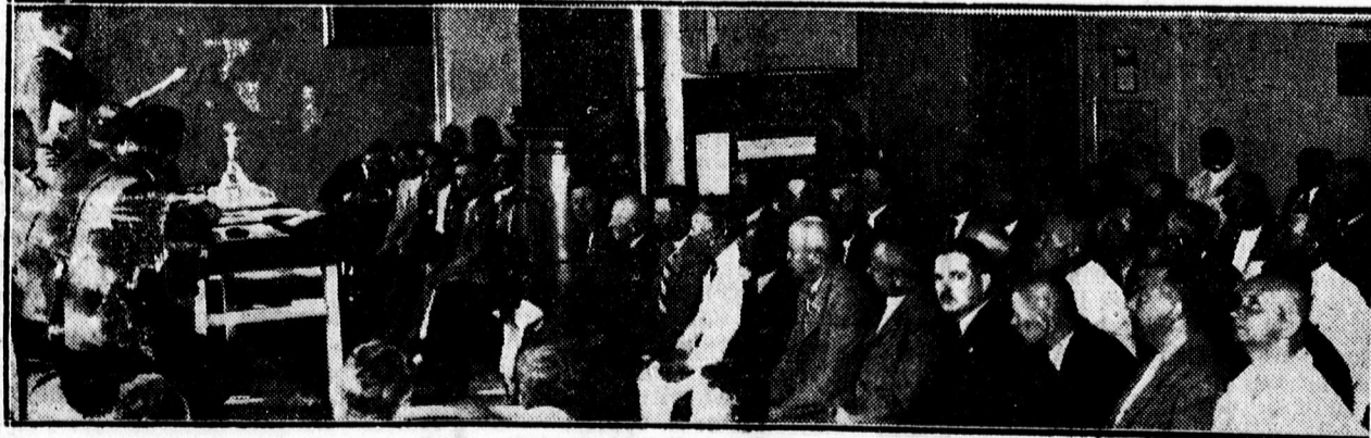
A Frontharcos Főcsoport közgyűléséről.