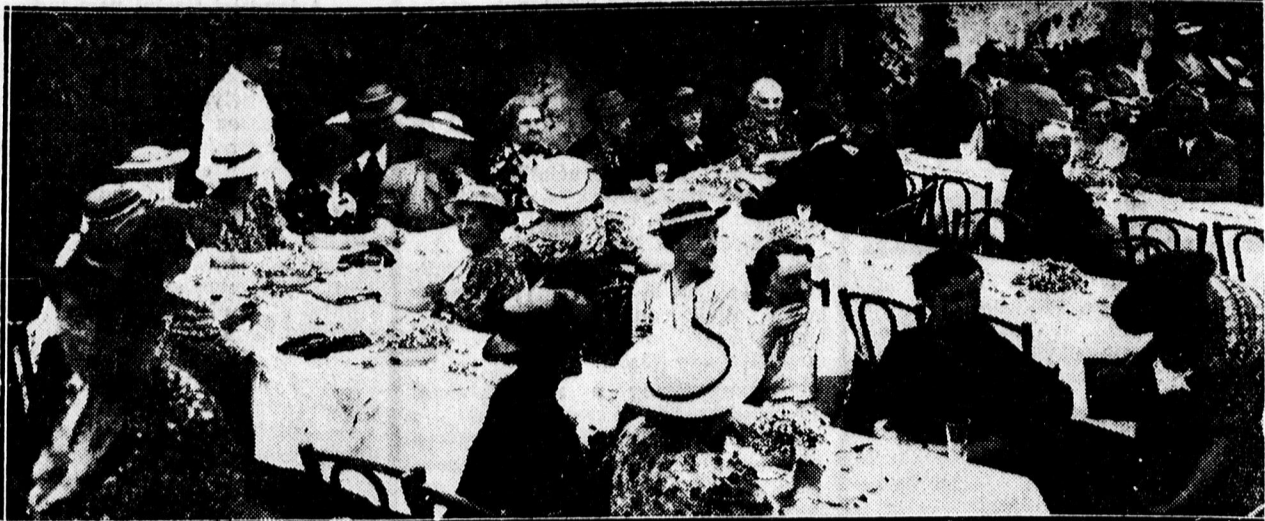
A Jótékony Nőegylet fogylaltdélutá njáról.

— Ujabb földrengés Belgiumban óriási károkkal. Brüsszelben vasárnap délután megismétlődött a földrengés, amelyet Belgium más részein is éreztek. A földrengés jóval gyengébb volt az elsőnél, mely évszázadok óta a leghevesebb volt Nyugat-Európában. A két földrengésnek óriási anyagi kára van. Az egyik templomban esküvőt akadályozott meg a földrengés s a násznap, a mátkapár és a pap a szabadb menekültek.