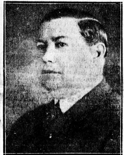
Lossonczy István, az új főispán.

val és szaktudással, rátermettséggel látja el mindenki teljes megelégedésére és töle telhetőleg igyekszik a jogos és méltányos gazdakisvanságokat eredményesen képviselni.