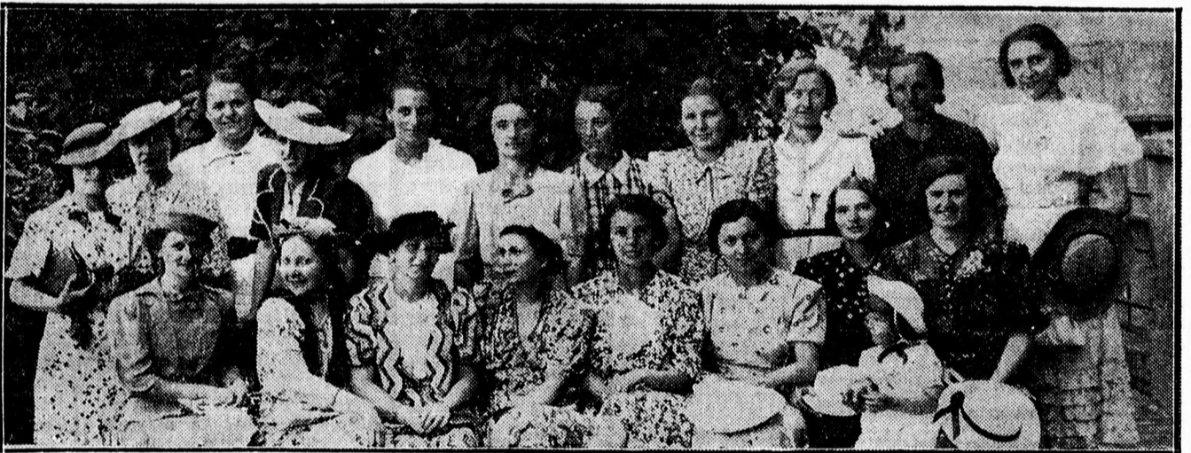
10 éves találkozó résztvevői a Svetits intézetben.