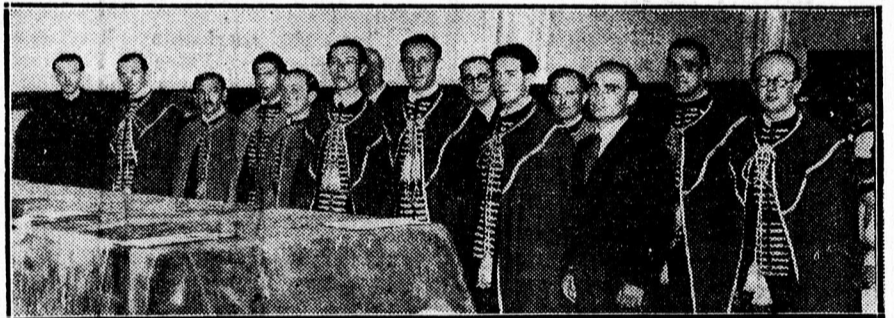
A tegnapi doktoravatásról. (Az új doktorok.)

— Tízéves találkozó . Mindazok, akik a debreceni 969. sz. „Gróf Csáky biboros” eserkészecsapat elmult tíz esztendejében annak felvirágoztatása érdekében közreműködtek, f. évi július hó 3-án délelőtt tartják jubileumi összejövetelüket az Angol Királynő „Bundájában.” Meghívókat nem bocsátanak ki. Minden felvilágosítást szívesen megadnak Vojth