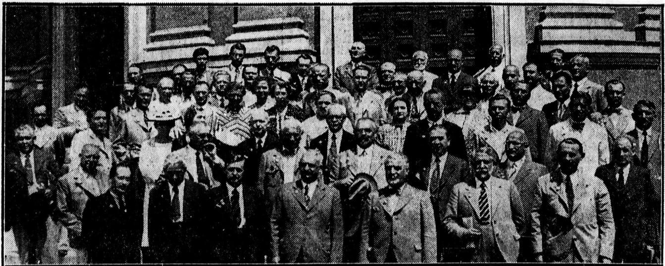
A mérnök kongresszus résztvevői.