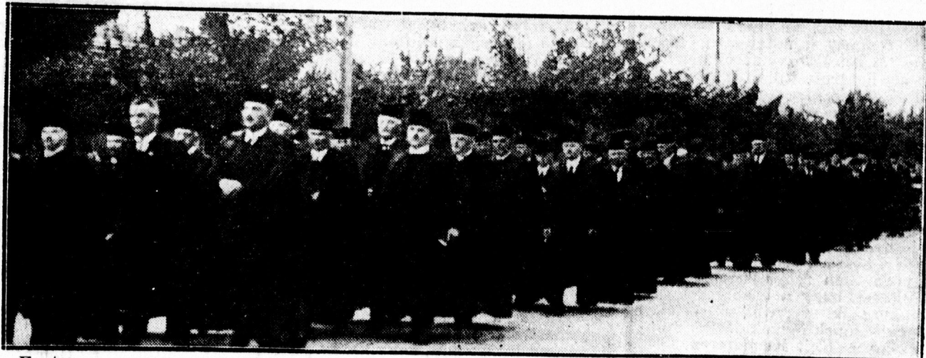
Fent: Maklár Károly püspököt utolsó útjára kísérik. Lent: 160 palástos lelkész a temetési menetben.