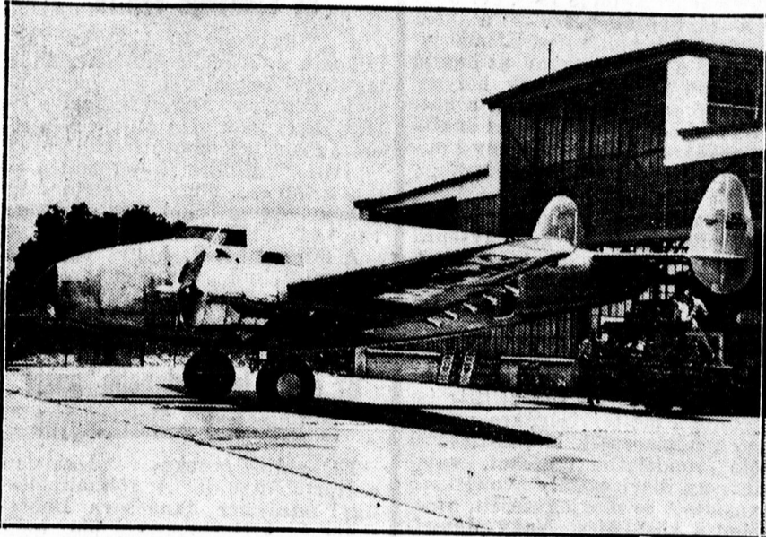
Hughes repülőgépe, mellyel körülrepülte a földet.

Tomboló lelkesedéssel fogadták a Newyork melletti repülőtéren. — Közel négy nappal javította meg az eddigi világrekordot.