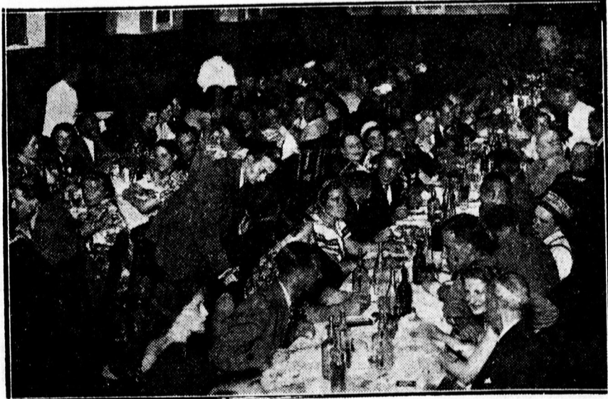
Ismerkedési est az Arany Bika dísztermében.