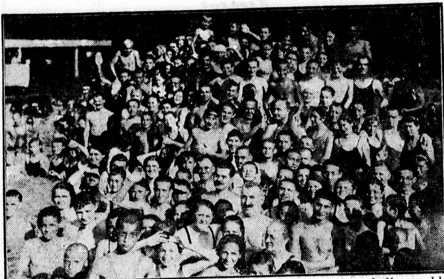
Több ezer ember strandolt vasárnap a zápor után még kellemesebb nagyerdei strandon.

— Egy beteg német tornászt a csehek megtámadtak Bodenbach határállomáson és súlyosan bántalmazták. A bántalmazott német tornász, Fridrich Serehe a vonaton a betegfülkében feküdt, mikor a cseh határőrök bántalmazták.