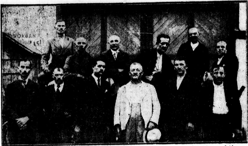
A kerékgyártó és kovács szakosztály mestereinek csoportja, akik a szekereket szállították.

Az első szállítás eredményének sajtóbemutatója.