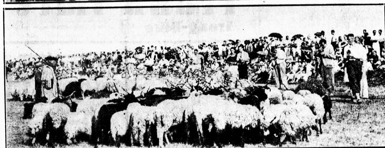
A Nyári Egyetem külföldi hallgatói és az amerikai magyarok csoportja a hortobágyi ünnepélyen.

Félárnál is olcsóbban vásárolhat az idényvégi vásáron elismert minőségű divatanyagokat a Klein Divatházban! Vásároljon, míg a választék nagy