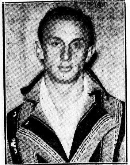
Dr. Csik Ferenc olimpiai világbajnok, aki lázas betegsége miatt nem indul a 100-as döntőn.

A vizsgálat egyébként azt is megállapította, hogy a kocsi vezető a legnagyobb gonddal járt el az esetnél, s így nem terhel senkit felelőség a tragikus balesetért.