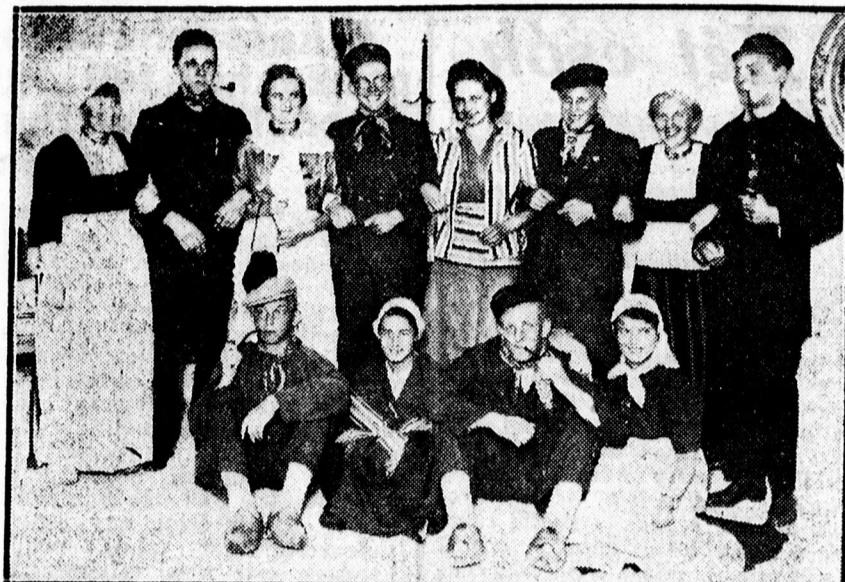
A Nemzetek Ünnepe holland szereplői.