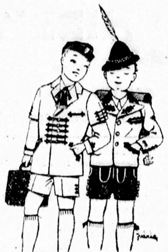
Vigan járnak iskolába Grünfeldtől kapott ruhába! Jo anyagja, szép szabása, Alig pár pengő az ára!

Klein Imre vásári kereskedőt azzal szedték rá, hogy egy vegyész-fogas segítségével a papírpénzt meg tudják sokszorosítani. Klein