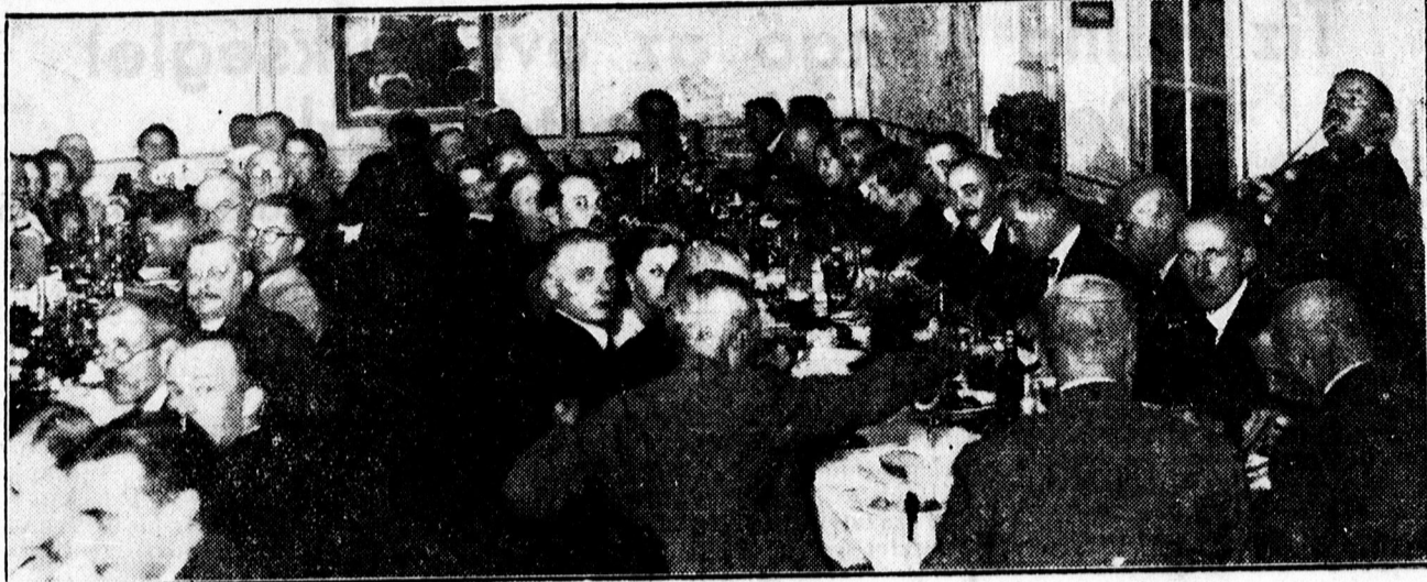
Pénzügyi tisztviselők összejöveteléről a pénzügyi kuglizó nagytermében.

Ma: 5, 7, 9 órakor, csak felnőtteknek: HETEDIK Mennyország. — Megelőzi: Futball világbajnokság, régi Spanyolország. — Szombaton: TOVARIS.