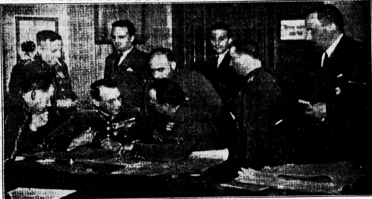
A magyar-cseh katonai szakértők tanácskozása Komáromban.

Mint értesülünk, megbeszéléseket folytat politikusokkal. Érintkezést keres az illetékes tényezőkkel is.