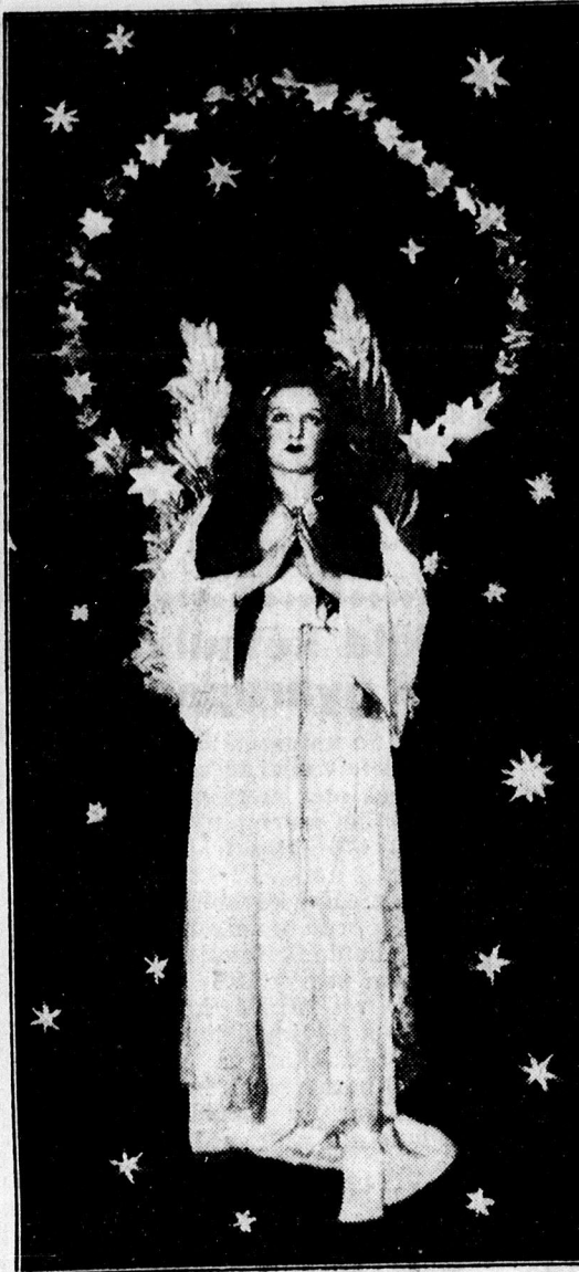
Az angyal leszáll az égből a vezérigazgató szobájába.