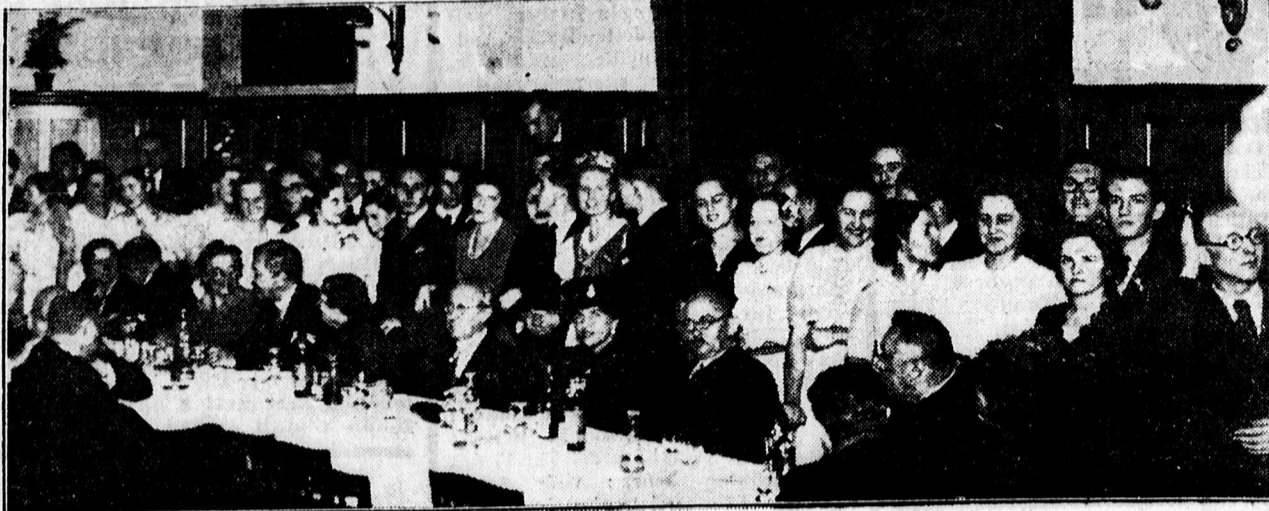
Szent László Kör ismerkedési estje a Magyar a magyarért akció javára az Arany Bika üvegtermében