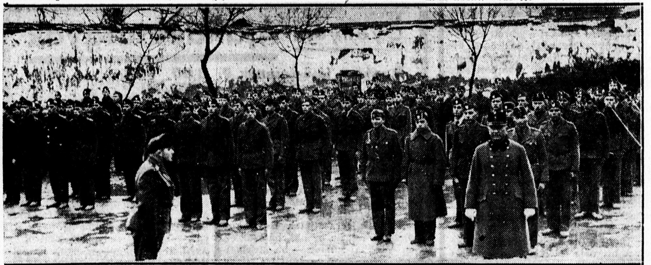
FENT: Előkelőségek a leventeszázad feletti szemlén. LENT: Debreceni leventék diszszázada.