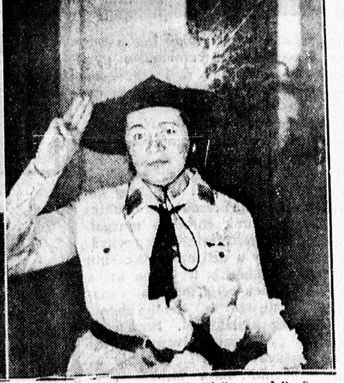
HALASSY: A főnököm esküvőjére csak elmegyek.