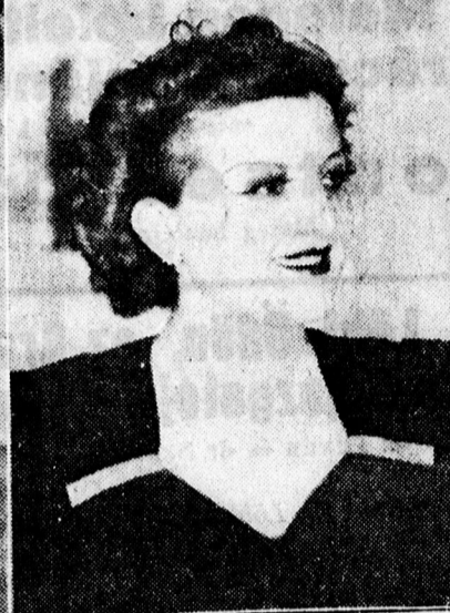
A nő, aki kezd.