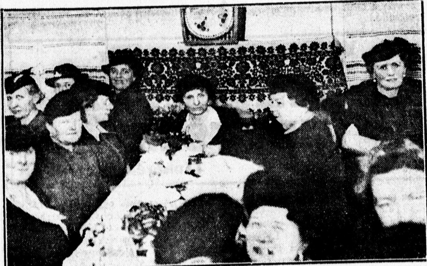
A Mansz kávé-délutánjáról.