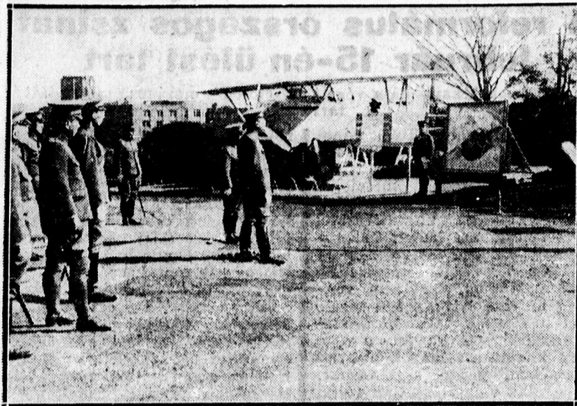
A japán császár megtekinti a kínaiaktól zsákmányolt hadiszereket.

— Lezuhant vizirepülőgép. Brestből jelentik: Egy vizirepülőgép a douarnenez-i öböltől három kilométernyire lezuhant. Három ember életét veszítette, egy pedig súlyosan megsebesült.