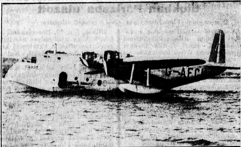
Tavasszal megindul az északatlantióceáni repülőjárat: A Cabot nevű hatalmas négymotoros gép fogja a szolgálatot lebonyolítani.