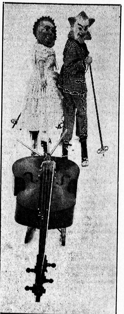
Svájel karikatúra, mellyel kifigurázzák a muzsikusokat, akik hajnalban sztalppal járnak haza és szánk huzak maguk után a hegedűjüket.