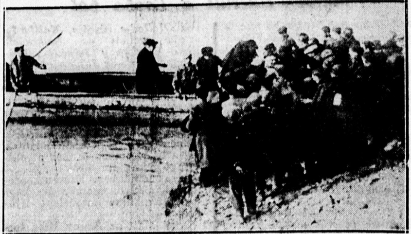
Barcelonai menekültek, akik a köztársaságiak előtt menekültek, most a nemzeti csapatok bevonulása után visszatérnek.