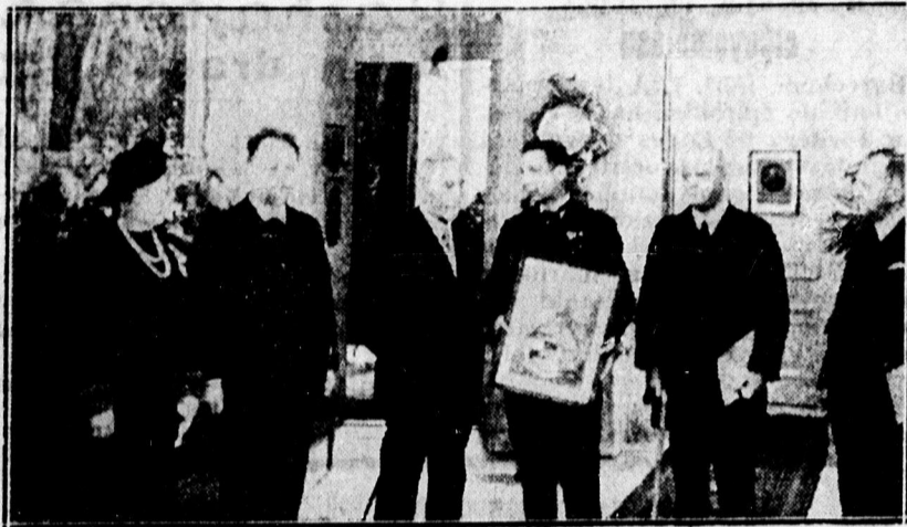
II. Vilmos német császárral 80-ik születésnapján fogadja a dorni polgármestert.