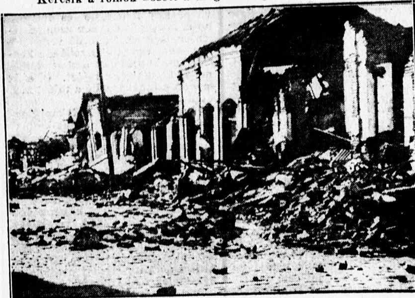
Az összeomlott katedrális.

A „Farsang királynője” és fényes kísérete a február 11-iki Lilla teán