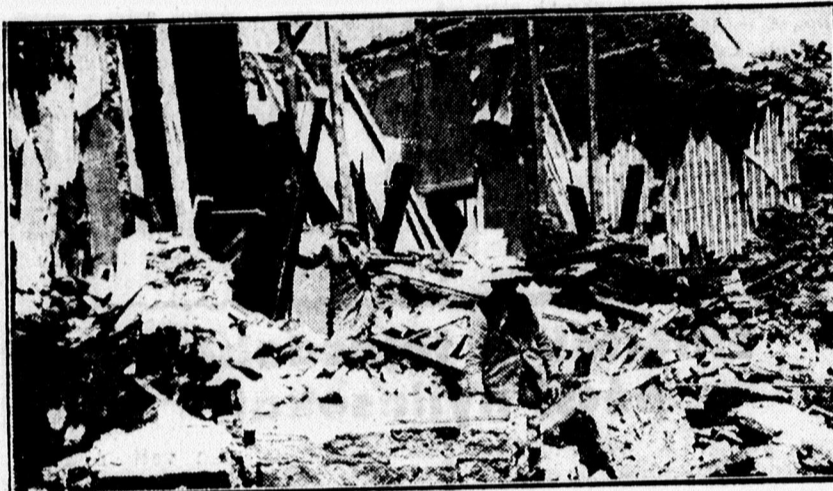
Keresik a romok között a még esetleg élő sebesülteket.

A CHILEI FÖLDRENGÉS BORZALMAS PUSZTÍTÁSA.