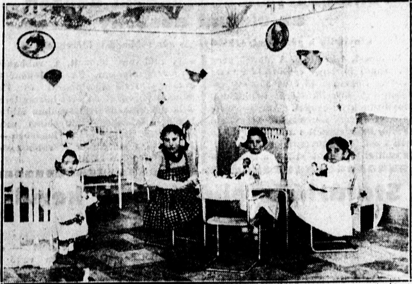
Gyermekotthon a római opera epületében. Itt elhelyezik gyermekeiket azok a szülők, kik az operaelőadást kívánják hallgatni és nincs kire hagyni apróságukat.