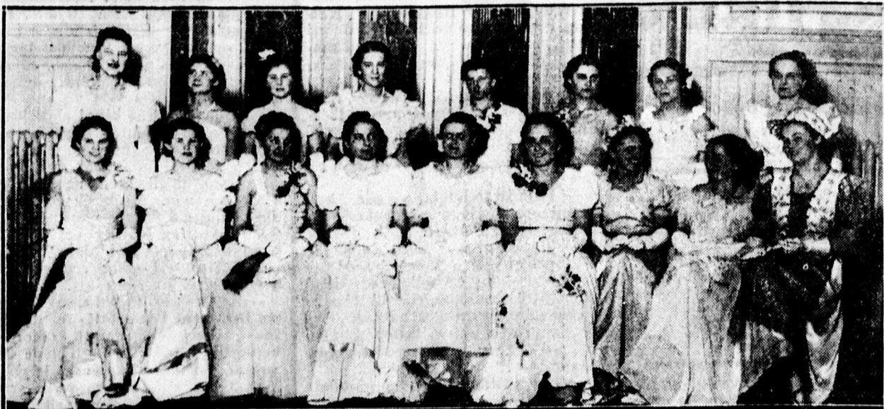
Első bálzó urleányok a Gazdász-bálon.

— Az élmunkásokat a szovjet ipari telepein igen gyűlölik a többi munkások és az egyik kerületben egy év alatt 128 élmunkást vertek agyon a textilmunkások. Hasonló a helyzet a többi kerületben is.