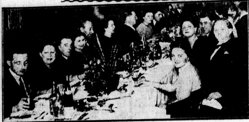
Mérnöki és építész vacsora.