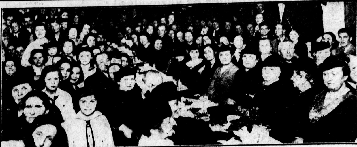
Vasárnap ünnepelték a Templomegyesület leánycerkészesapatai fennállásuk tizedik évfordulóját. Képünk: az ünnepély közönsége.