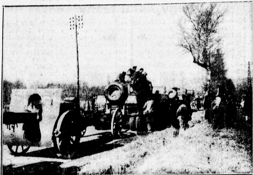
A menekülő köztársasági spanyol csapatok felszerelésekkel együtt Francia területre menekülnek.

A világ legnagyobb léghadereje Németországé, mint Johnson angol légügyi szakértő mondja. Ebből a léghaderőből 3500 repülőgép bármely pillanatban harcra kész állapotba helyezhető.