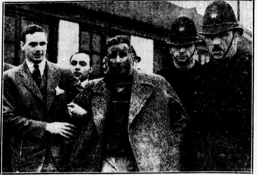
Egy 24 éves angol pilóta London és Fokváros között a rekordot 30 órával rövidítette meg. Az óriási se besség következtében a bőrén mindenütt áttűtött a vér.