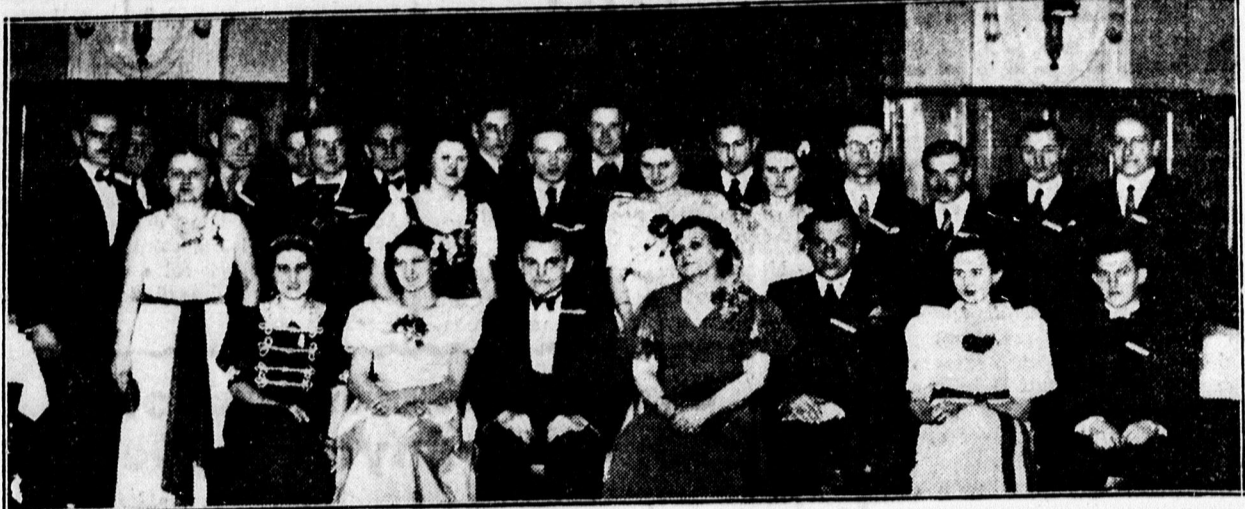
A Vasvári Pál Kör táncestélyének rendezőbizottsága.

Az előadásban megjelent szép számú gyermekközönség pirosra tapsolta tenyerét a kis művészek remek játékán. Csak őszinte dicséret hangján szólhatunk a színház-