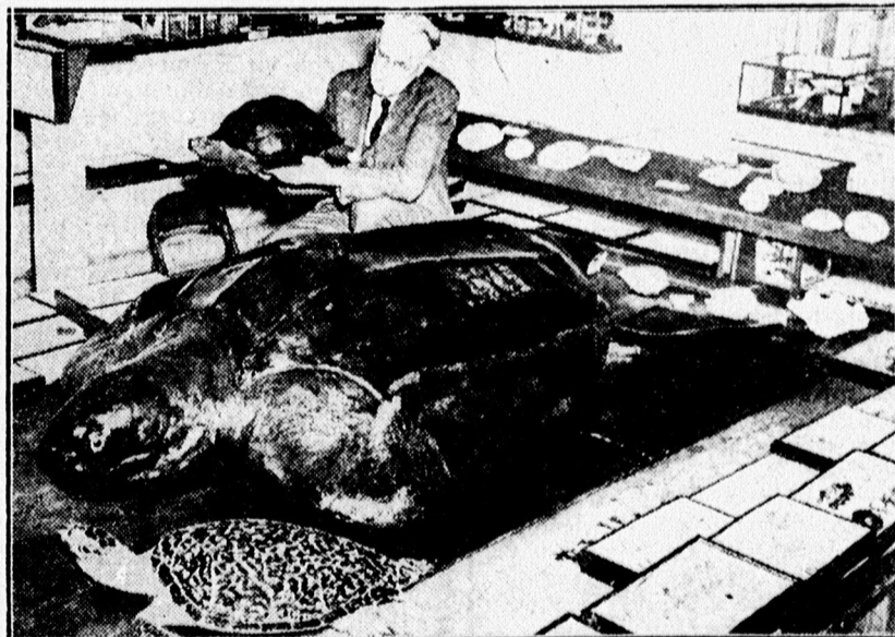
A világ legnagyobb technobékáját nem régen találták meg Kaliforniában. Ed-dig a legnagyobb az volt, amelyet a képen látható ember a kezében tart. A technobéka hossza 2 méter 20 cm., kitömve műzumba viszik.