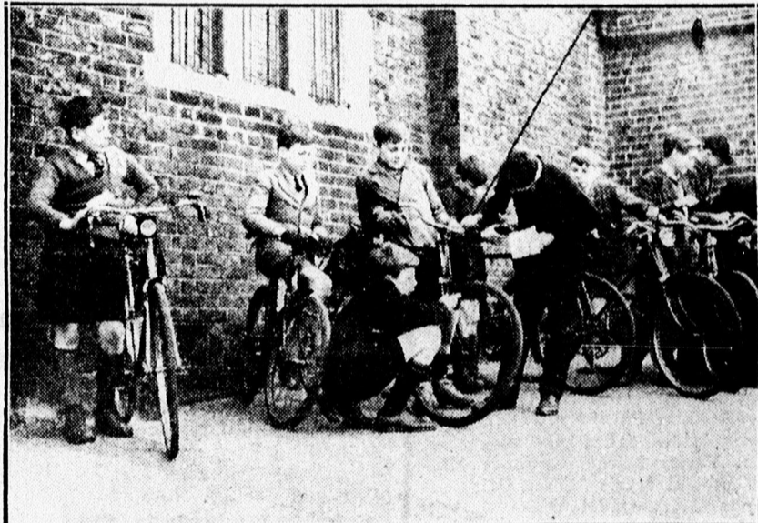
Angliában az iskolásgyermeknek vizsgáznia kell kerékpározásról, erről bizonyítványt kapnak.

Lelkes fényképész, akinek szakcikkei a világ számos fényképezési folyóiratában megjelentek. Résztvett az összes nemzetközi fényképkiállításokon és mindenhonnan aranyérmekkel, elsődíjakkal küldték vissza szebbnél-szebb fényképeit.