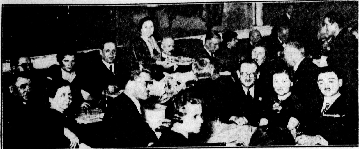
A Csizmadia áruzsarnok szövetkezet estélyéről.