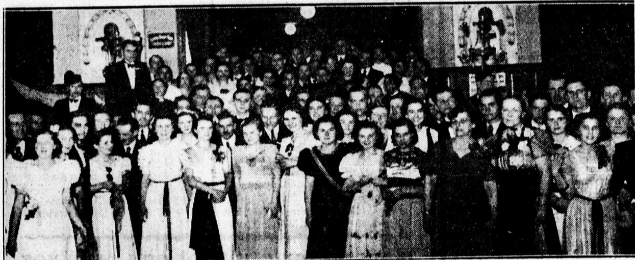
Vasvári est közönségnek egyrésze az Arany Bika üvegtermében.

ról, hogy a jövőre is gondolva, igyekeznek áldozattal is a gyermekeknek is nyújtani művészi élvezetet s ezzel kinevelni a jövő színházi publikumát. Olyan elismerésre méltó gesztus ez, melyet követhetnek a mozgósítványok is.